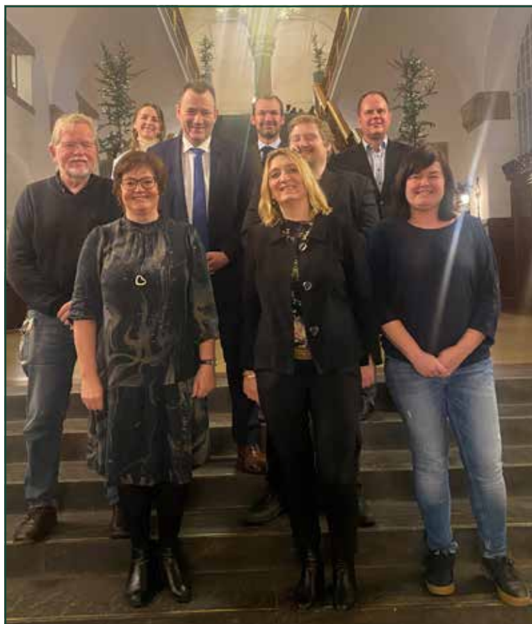
Sydslesvigudvalget og dets sekretariat.

Aktuel status: på grund af COVID-19 epidemien lykkedes det ikke at realisere alle projektets målsætninger i 2021, ligesom bl.a. en skolerejse til Sydslesvig først finder sted i 2022.