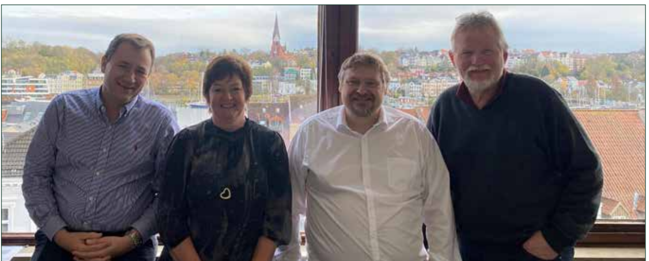
Forhandlergruppen i Flensborg.

Den 19. marts 2021 var der frist for at søge om at indgå en resultataftale med udvalget i 2022. Neden for ses de ni foreninger, som ansøgte om driftstilskud via en resultataftale.