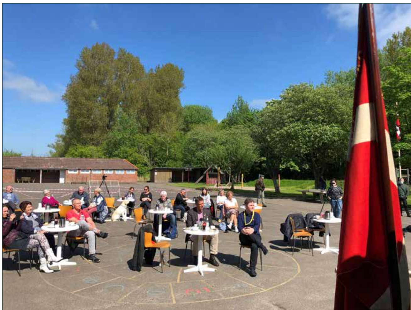
Årsmøder i Sydslesvig 2021.

Beretningen indledes med en kort præsentation af Sydslesvigudvalget, og derefter introduceres udvalgets overordnede opgaver. Dernæst følger en beskrivelse af årets konkrete opgaver, herunder udarbejdelse af resultataftaler for 2022, projekttilskud 2021, den årlige besigtigelsestatus m.v.