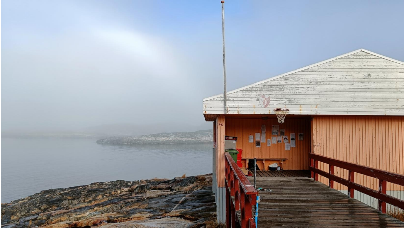
Kommunekontoret i Saarloq