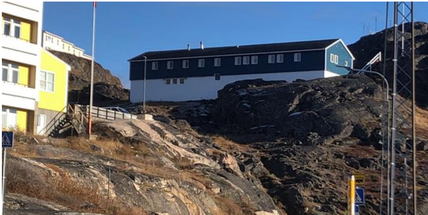
Anstalten for Domfældte i Qaqortoq