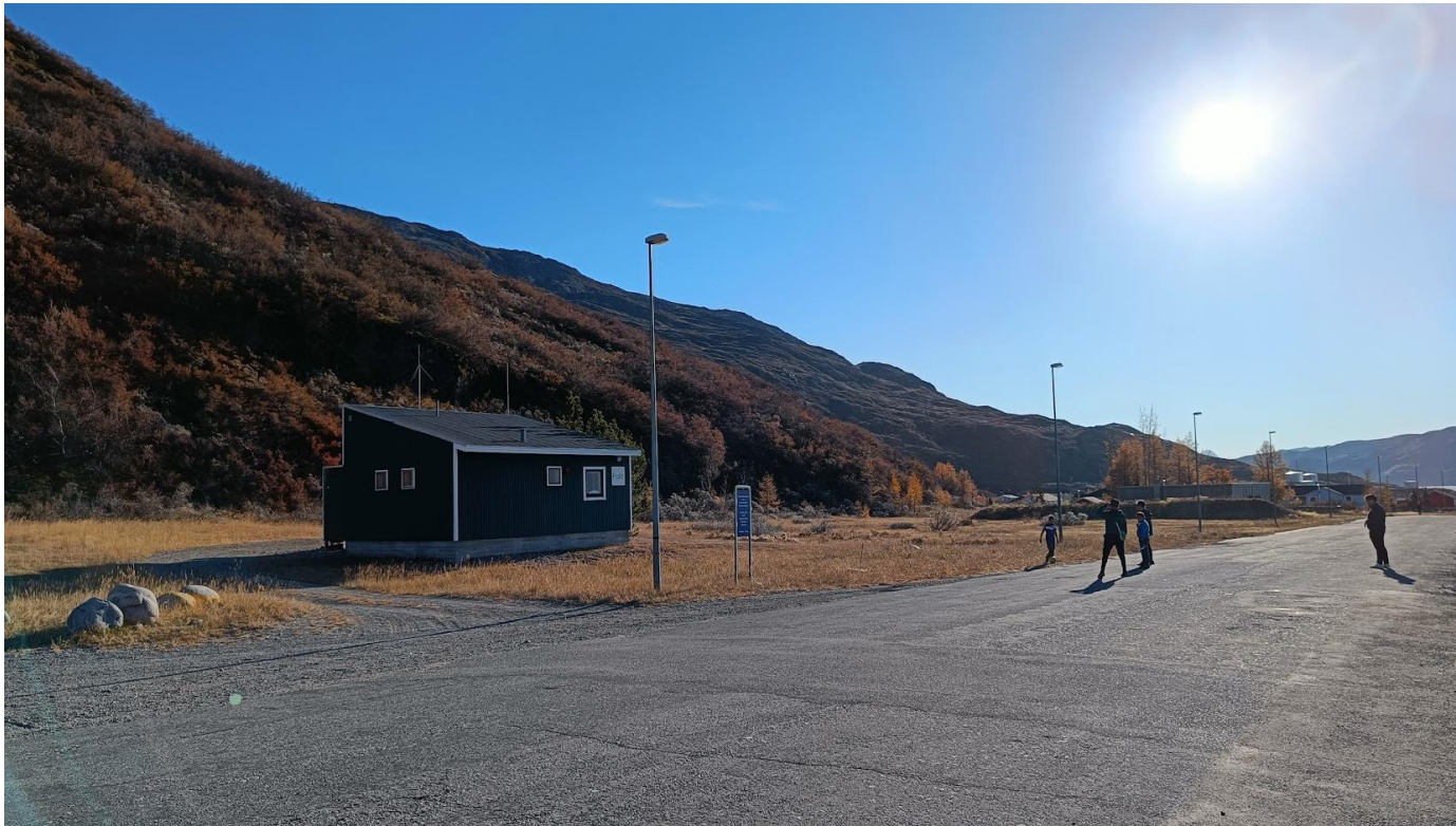
Detentionen i Narsarsuaq