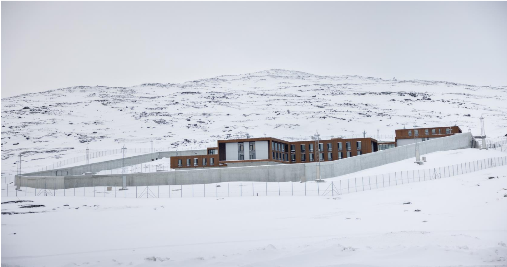
Anstalten for Domfældte i Nuuk