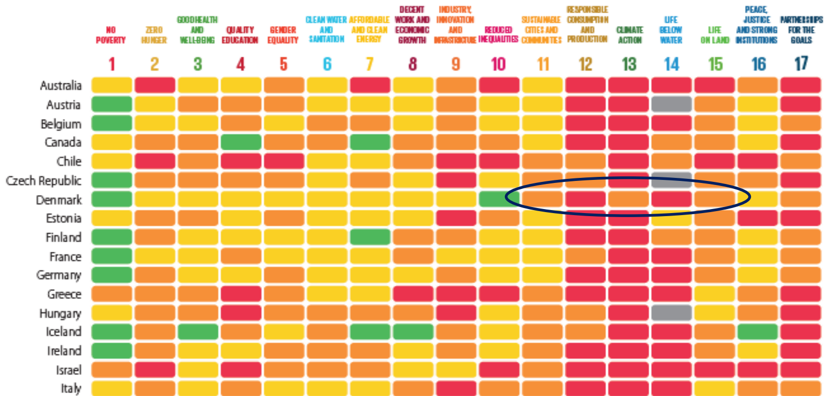
Figure 7 | SDG Dashboard for OECD countries