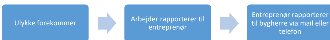
Figur 2 og 3 udledt af forfatterne på baggrund af interview

Den direkte rapporteringspraksis (Figur 3) foregår ved, at entreprenøren tager direkte kontakt til bygherres arbejdsmiljøkoordinator i tilfælde af, at der forekommer en ulykke. At rapportere umiddelbart efter en hændelse muliggør, at bygherre kan deltage aktivt tidligt i processen, få adgang til den ønskede viden og deltage i eventuelle korrigerende eller forebyggende initiativer. Denne praksis hæver derfor potentialet for bygherrer, der selv ønsker tilstedeværelse tidligt i processen, og som på den måde kan engagere sig i arbejdsmiljøarbejdet.