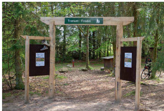
Start/slut: Skovlegepladsen Trantum Strandvejen 37, 9460 Brovst