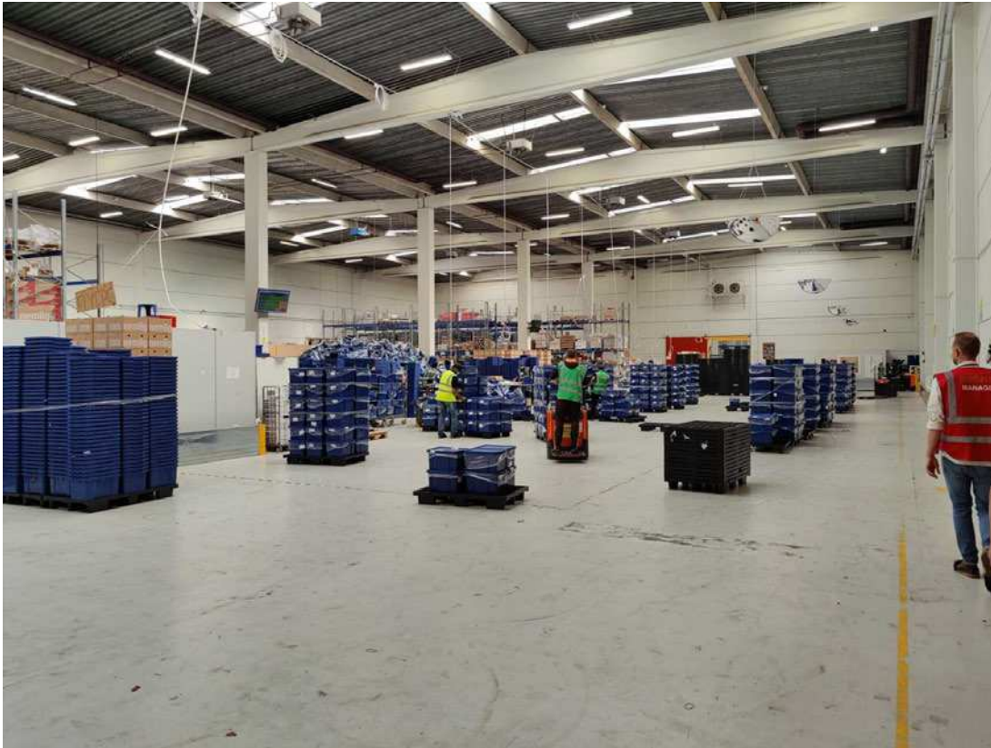
Til højre i billedet ses gangsti.