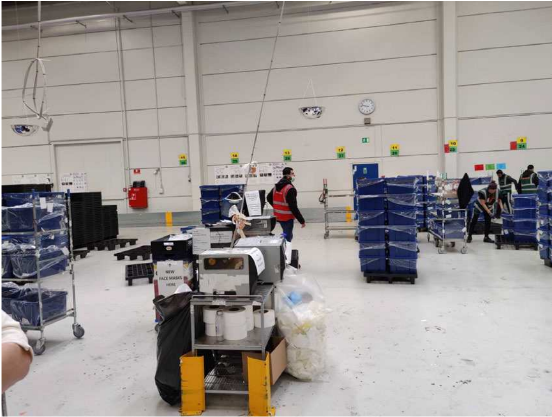
Midt i billedet ses bord med printer