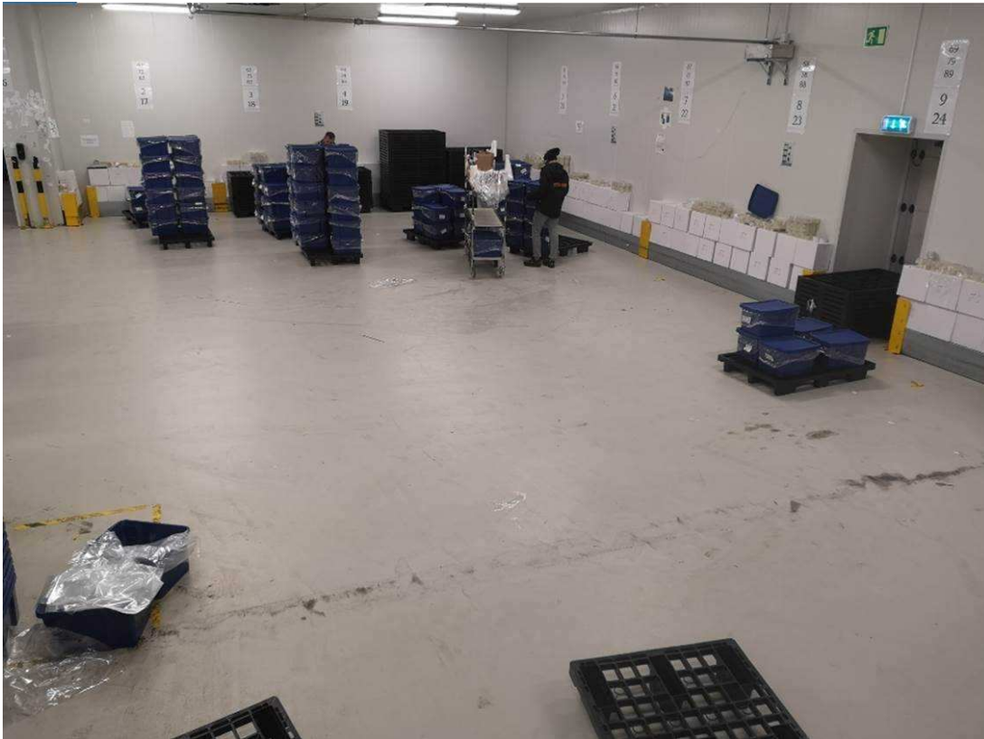
Intervare - konsolideringsområdet