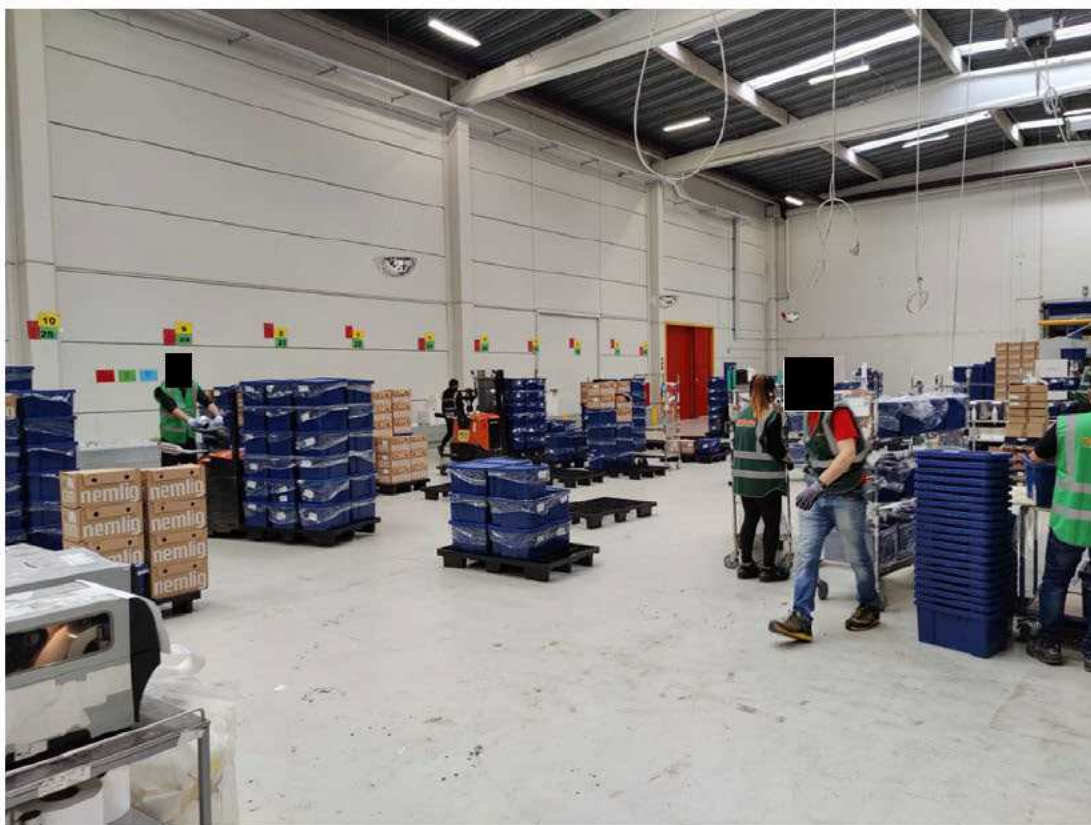
Til venstre ses truck hente palle med kasser og til højre ses gående med trolley.