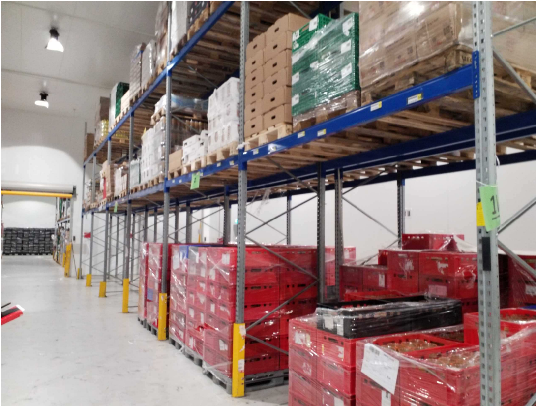
Pallereol på køl-lager med defekte tværstiver.