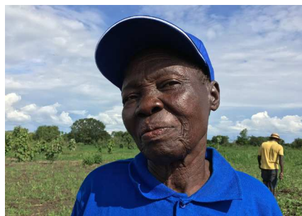
Danmark har i mange år kæmpet for kvinders rettigheder og ligestilling

Danmark spillede en aktiv rolle i det forberedende arbejde med at få vedtaget sikkerhedsrådsresolution 1325 og var i 2005 det første land i verden til at udarbejde en national handlingsplan for implementering af resolutionen. Handlingsplanen blev opdateret i hhv. 2008 og 2014. I 2005/06 havde Danmark desuden en plads i Sikkerhedsrådet og nød derfor