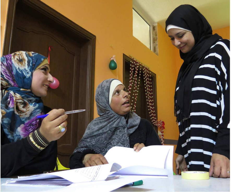
I mange lande er kvinder udelukket fra formelle såvel som uformelle beslutningsprocesser

Handlingsplanen bliver yderligere konkretiseret i de tilhørende implementeringsplaner for hver af de involverede instanser: Udenrigsministeriet, Forsvarsministeriet og Justitsministeriet (Rigspolitiet). Arbejdsgruppen koordinerer indsatsen med at følge op på implementeringsplanerne og civilsamfundets inddragelse. Det sker dels i et årligt kontaktforum, hvor planens strategiske og overordnede målsætninger drøftes, samt i mere specialiserede undersøgelser i form af