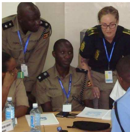
Danske politikvinder og -mænd bidrager med træning bl.a. i Afrika og Mellemøsten

I denne handlingsplan opererer vi med et binært kønsbegreb (kvinde/mand). Valget er truffet af praktiske hensyn, fordi det afspejler den differentiering, der rapporteres ud fra i vores aktiviteter. Kønsidentitet og kønsroller påvirkes ofte af et samfunds normer, kultur og forventninger. Dette tager vi hensyn til i de områder vi engagerer os i såvel som i den nationale indsats. Selvom anvendelsen af de binære kønsbetegnelser således er et praktisk valg, er det samtidig baseret på en bevidsthed om og anerkendelse af eksistensen af mere flydende kønsidentiteter end de binære kvinde/mand og pige/dreng.