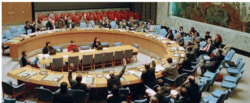
Resolution 1325 vedtages i FN's Sikkerhedsråd d. 31. oktober 2000

beskytte civilbefolkningen - særligt kvinder og piger. Fordi vi ofte arbejder og opererer i lande og samfund, hvor lokale kvinder netop har begrænset adgang til at deltage i politiske processer, er tilstedeværelsen af kvinder med til at øge adgangen og styrke dialogen. Det handler også om, at en mere repræsentativ sammensætning skaber bedre opgaveløsning og resultater. Danmark vil derfor øge fokus på rekruttering, fastholdelse og karrierefremme af kvinder, ikke mindst i ledelsespositioner, både inden for Forsvaret - herunder Hjemmeværnet og Beredskabet - inden for Rigspolitiet og i Udenrigsministeriet. Flere kvinder end tidligere ser i dag Forsvaret som en karrieremulighed, hvilket bl.a. har betydet en stigning i tilstrømningen af kvinder til både værnepligtsuddannelsen og Forsvarets øvrige uddannelser de seneste 12-15 år. Den gode udvikling skal vi fortsætte og forstærke, herunder gennem øget rekruttering,