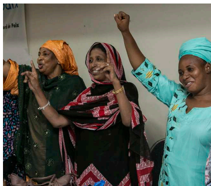
Kvinder i Mali deltager i et møde om at øge kvinders deltagelse i fredsprocessen

verdens brændpunkter, der har fokus på konfliktforebyggelse, konfliktløsning og fredsopbygning. Danmarks fredsopbygnings- og stabiliseringsindsatser finansieres primært gennem Freds- og Stabiliseringsfonden, som i højere grad skal målrettes til at styrke dagsordenen for kvinder, fred og sikkerhed. Kommende evalueringer og programmer vil derfor indeholde en vurdering af, hvordan nuværende og fremtidige aktiviteter i endnu højere grad kan indarbejde kønsperspektiver og skabe resultater for de kvinder og piger, der lever i indsatsområderne. Desuden vil såvel internationale som lokale implementerende samarbejdspartnere, hvor relevant, blive bedt om at forholde sig konkret til, hvordan WPS-dagsordenen kan styrkes gennem fremtidige aktiviteter. Det er Freds- og Stabiliseringsfondens mål at gøre en endnu større forskel også for kvinder og piger.