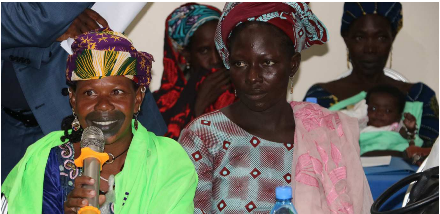
Kvinder i Mali deltager i en workshop om den regionale sikkerhedsstyrke, G5 Sahel fællesstyrken