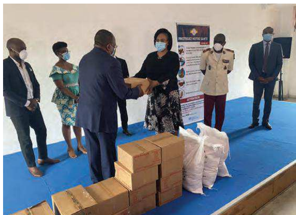
Billede 7: COVID-19 gjorde det i 2020 nødvendigt for UN PBF at udvise omfattende fleksibilitet i implementeringen af eksisterende og nye indsatser. Dette førte særligt i Vestafrika til et stigende fokus på beskyttelse og fremme af menneskerettigheder.

COVID-19 medførte også stigende fokus på menneskerettighedsovergreb ifm. erklæringen af undtagelsestilstand i en række lande med særligt fokus på Vestafrika. I Gambia støttede UN PBF etablering og kapacitetsopbygning af den nationale menneskerettighedskommission, der ifm. COVID-19 øgede sin træning af politiet i rettighedsbeskyttelse. I Guinea blev 35 repræsentanter for lokale menneskerettighedsgrupper trænet for at styrke kapaciteten til at monitorere sikkerhedsstyrkers adfærd og dokumentere eventuelle menneskerettighedsovergreb. I Togo støttede UN PBF ligeledes træning af 15 menneskerettighedsforkæmpere i at monitorere menneskerettighedsovergreb samt finansierede relevante teknologiske redskaber til indhentning og deling af information. Projektet viste hurtigt resultater og i sommeren 2020 var ca. 30 sager blevet rapporteret.