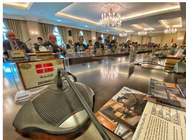
Billede 3: Møde i Bagdad med den irakiske regering om den internationale stabiliseringsindsats.

til at inkludere projekter med direkte relevans for respons på COVID-19.