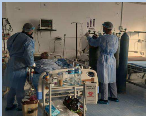
Billede 2: Udsnit af ny-oprettet behandlingscenter i Raqqa.

Også Rigspolitiet har måttet omstille deres indsatser, eksempelvis i Irak, hvor de sammen med FN gennemførte kurser virtuelt, så de danske instruktører i Danmark stod for undervisningen, og de irakiske kursister var samlet i Irak og modtog undervisningen via storskærm. Afviklingen af kurserne virtuelt gav positiv feedback fra de irakiske kursister, og i alt afviklede dansk politi syv kurser i henholdsvis efterforskning og analysebaseret politiarbejde med i alt 98 irakiske kursister og to danske politiinstruktører i løbet af 2020.