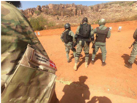
Billede 10: Fra Forsvarsakademiets konference på Kofi Annan International Peacekeeping Training Centre, Ghana.

samfundene i de berørte områder desuden fået indført varslingsmekanismer.