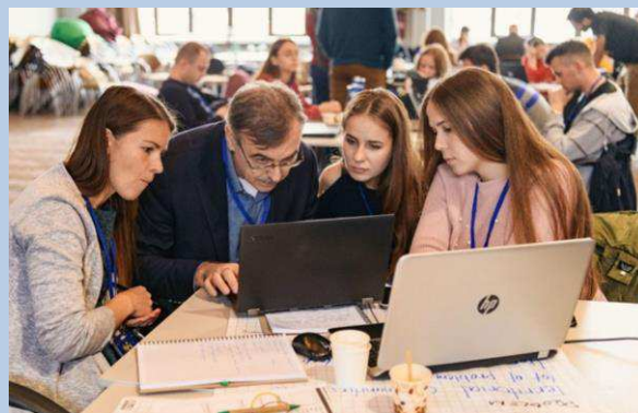
Billede 9: Hack For Locals 1.0 i byen Kharkiv. Her mødtes lokale borgere, NGO'er og virksomheder for at finde konkrete digitale løsninger på hverdagsproblemer i Østukraine.

COVID-19 har skærpet behovet for digitale løsninger. Men i Østukraine har nye e-løsninger også været med til at løse mere grundlæggende problemer med adgang til offentlige services og deltagelse i beslutningsprocesser.