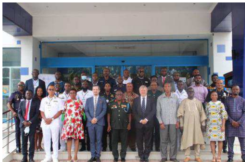
Billede 12: Kursister på maritimt sikkerhedskursus i Takoradi, Ghana, ved Kofi Annan International Peacekeeping Training Centre i august.