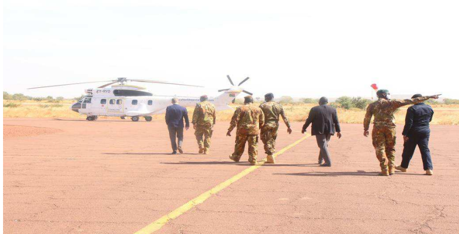
Billede 1: Danmark bidrager bl.a. gennem EUCAP Sabel Mali til at støtte de maliske sikkerhedsstyrkers genetablering af statsstrukturer og den civile administration i landområderne, særligt i det centrale Mali.

COVID-19 har illustreret, at der også i fremtiden vil være behov for, at Freds- og Stabiliseringsfonden kan imødekomme akutte behov for allokering af midler til fleksibel og hurtig støtte i skrøbelige kontekster og konfliktområder, der falder inden for regeringens prioriteter.