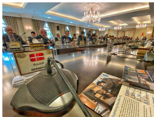
Billede 3: Møde i Bagdad med den irakiske regering om den internationale stabiliseringsindsats.

til at inkludere projekter med direkte relevans for respons på COVID-19.