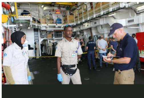
Billede 6: Den danske politirådgiver sekunderet til UNODC træner somalisk maritimt politi i, hvordan man undersøger gerningssteder.