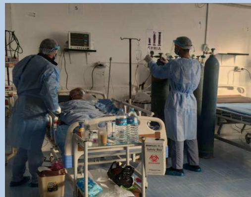
Billede 2: Udsnit af ny-oprettet behandlingscenter i Raqqa.

Også Rigspolitiet har måttet omstille deres indsatser, eksempelvis i Irak, hvor de sammen med FN gennemførte kurser virtuelt, så de danske instruktører i Danmark stod for undervisningen, og de irakiske kursister var samlet i Irak og modtog undervisningen via storskærm. Afviklingen af kurserne virtuelt gav positiv feedback fra de irakiske kursister, og i alt afviklede dansk politi syv kurser i henholdsvis efterforskning og analysebaseret politiarbejde med i alt 98 irakiske kursister og to danske politiinstruktører i løbet af 2020.