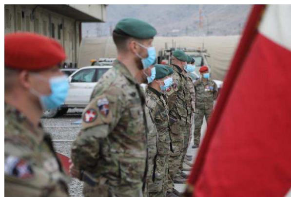
Billede 4: Afghanistan: Soldaterne fra det nationale støtteelement hold 13 står klar til medaljeparade.

Trods aftalen mellem USA og Taleban om tilbagetrækning af USA's militære styrker fortsatte konflikten i 2020 med kampe mellem afghanske sikkerhedsstyrker og Taleban og andre grupper, herunder ISIL, i tillæg til målrettede angreb på prominente personer som f.eks. journalister og dommere. Fredsforhandlingerne med Taleban påbegyndtes i september i Doha, og USA havde ved årets udgang omkring 2.500 soldater i Afghanistan.