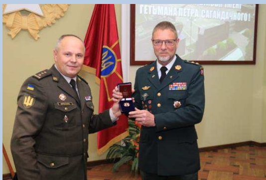
Billede 8: Rådgiveren tildeles ukrainsk æresmedalje (Badge of Honour).

Som en del af den danske støtte til Ukraine inden for rammerne af Fonden har det danske forsvar i 2020 haft en rådgiver udsendt ved skolen. Rådgiveren har været med til at udvikle en moderne videreuddannelse for officerer i tråd med NATO-standarder og har ydet en meget anerkendt støtte til sproguddannelsen. Den 9. december 2020 blev rådgiveren tildelt den ukrainske forsvarsministers æresmedalje Badge of Honour for sin indsats ved skolen.