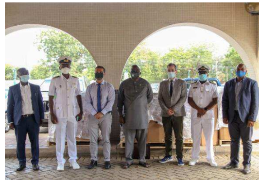
Billede 13: Overdragelse af videokonferencendstyr i Ghana.