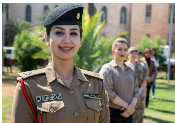
Billede 16: Også i Irak blev 20-året for FN's resolution 1325 om kvinder, fred og sikkerhed fejret. Danmark støtter gennem Freds- og Stabiliseringsfonden Iraks arbejde med fremme af dagsordenen.

I 2021 vil Freds- og Stabiliseringsfonden i alt have en ramme på 513,8 mio. kr., hvoraf 102,5 mio. kr. kommer fra Forsvarsministeriet, mens Udenrigsministeriet bidrager med 400 mio. kr. ODA samt 11,3 mio. kr. i non-ODA.