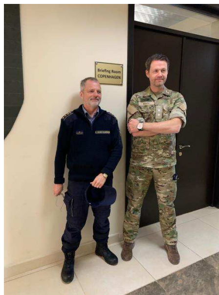
Billede 14: De to udsendte danske rådgivere i Georgien foran et dansk doneret mødelokale i JTEC.

supplering af det daglige beredskab under Emergency Management Services.