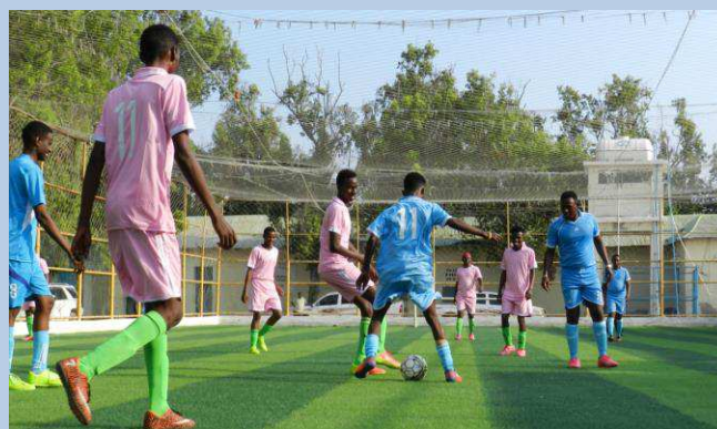
Billede 5: Fodboldturnering i Serendi centeret for al-Shabaab -afhoppere i Mogadishu, Somalia.

I Somalia fortsatte samarbejdet med regeringen om demobilisering og rehabilitering af al-Shabaab -afhoppere, herunder træning i screening og risikovurdering af personer, der har nedlagt våbnene og udtrykt ønske at om at blive rehabiliteret og reintegreret i deres oprindelige lokalsamfund.