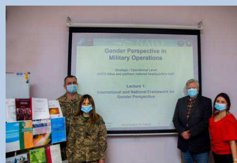
Billede 15: Undervisning i kønspektiver i den militære opgaveløsning ved NDU i Ukraine

Fremadrettet vil Fonden i højere grad tænke dagsordenen ind i tilrettelæggelsen af nye programmer og styrke engagementer, der flugter med prioriteterne for den nye danske handlingsplan.