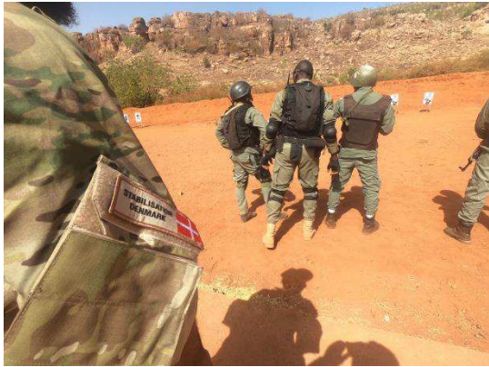
Billede 10: Fra Forsvarsakademiets konference på Kofi Annan International Peacekeeping Training Centre, Ghana.

samfundene i de berørte områder desuden fået indført varslingsmekanismer.