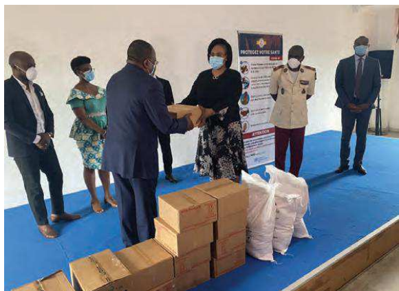
Billede 7: COVID-19 gjorde det i 2020 nødvendigt for UN PBF at udvise omfattende fleksibilitet i implementeringen af eksisterende og nye indsatser. Dette førte særligt i Vestafrika til et stigende fokus på beskyttelse og fremme af menneskerettigheder.

COVID-19 medførte også stigende fokus på menneskerettighedsovergreb ifm. erklæringen af undtagelsestilstand i en række lande med særligt fokus på Vestafrika. I Gambia støttede UN PBF etablering og kapacitetsopbygning af den nationale menneskerettighedskommission, der ifm. COVID-19 øgede sin træning af politiet i rettighedsbeskyttelse. I Guinea blev 35 repræsentanter for lokale menneskerettighedsgrupper trænet for at styrke kapaciteten til at monitorere sikkerhedsstyrkers adfærd og dokumentere eventuelle menneskerettighedsovergreb. I Togo støttede UN PBF ligeledes træning af 15 menneskerettighedsforkæmpere i at monitorere menneskerettighedsovergreb samt finansierede relevante teknologiske redskaber til indhentning og deling af information. Projektet viste hurtigt resultater og i sommeren 2020 var ca. 30 sager blevet rapporteret.