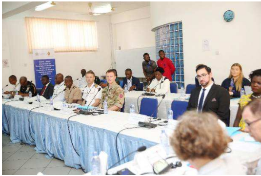
Billede 11: Fra Forsvarsakademiets konference på Kofi Annan International Peacekeeping Training Centre, Ghana.