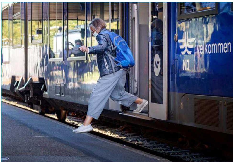
Figur 1 Billede fra perronen i Brønderslev

Perronen på Brønderslev Station er lavere end på mange andre stationer, og det betyder, at passagererne skal over et højt trin for at komme ind og ud af toget. Nedenstående billede beskriver forholdene på perronen.