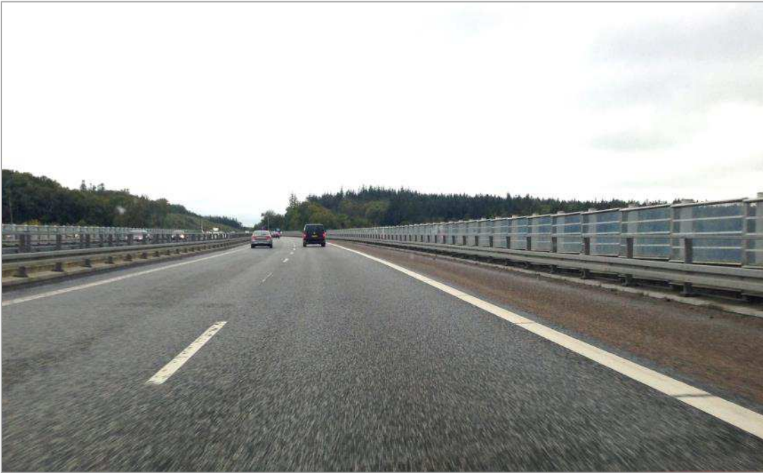
Støjafskærmning over Funder Ådal med de store ubebyggede naturområder på begge sider.