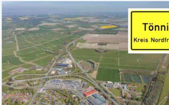
Tönning Kreis Nordfriesland