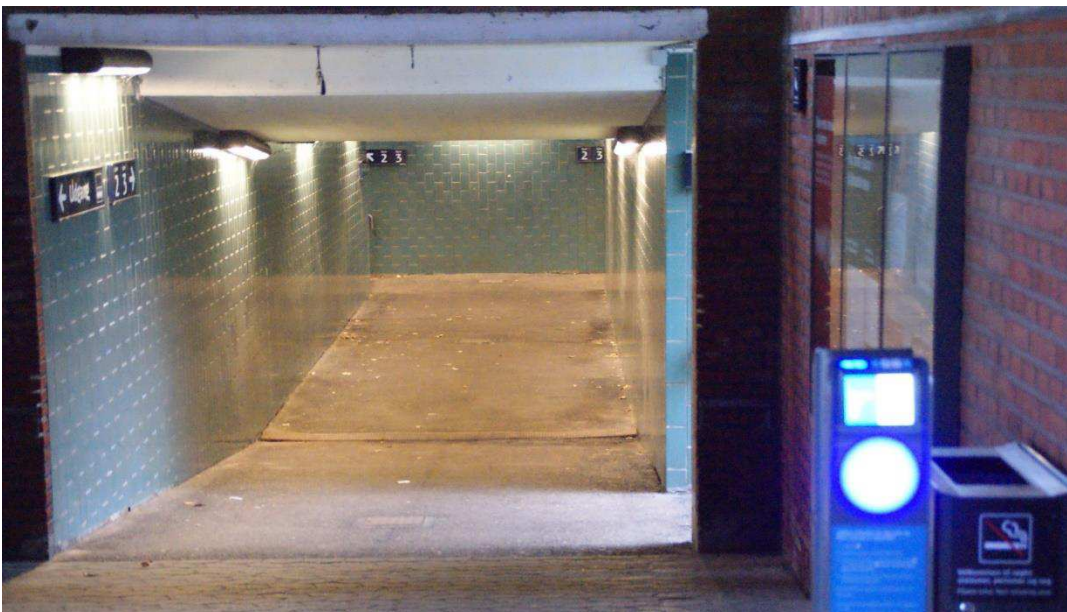
Tunnelen set fra indgangen. For enden af tunnelen trappe til begge sider.

Røde Kro Station benyttes af borgere fra Aabenraa, Bov, Lundtoft, Røde Kro, Tønder, Løgumkloster, dele af Haderslev Kommune, dele af Sønderborg Kommune. Røde Kro Station har tre spor, spor 1,2,3. Spor 1 benyttes ikke af passagertog. Adgang til sporene 2 og 3 via tunnel og trappe. Fra stationsbygningen direkte adgang til tunnel uden trappe.