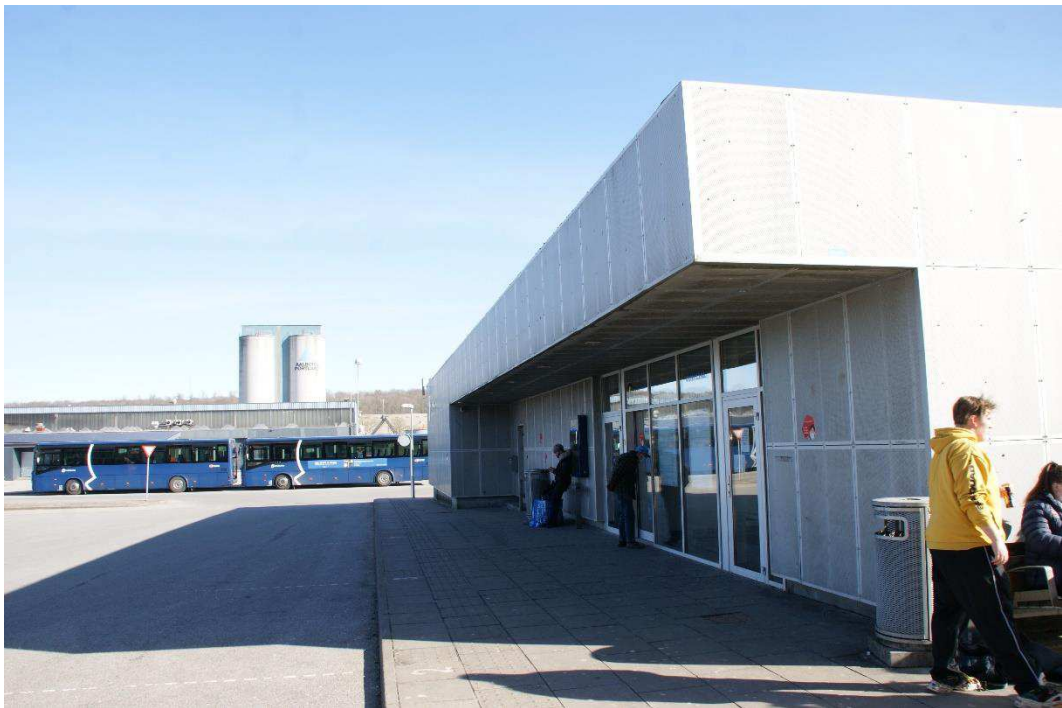
Aabenraa Busstation. Ventesalen er lukket.