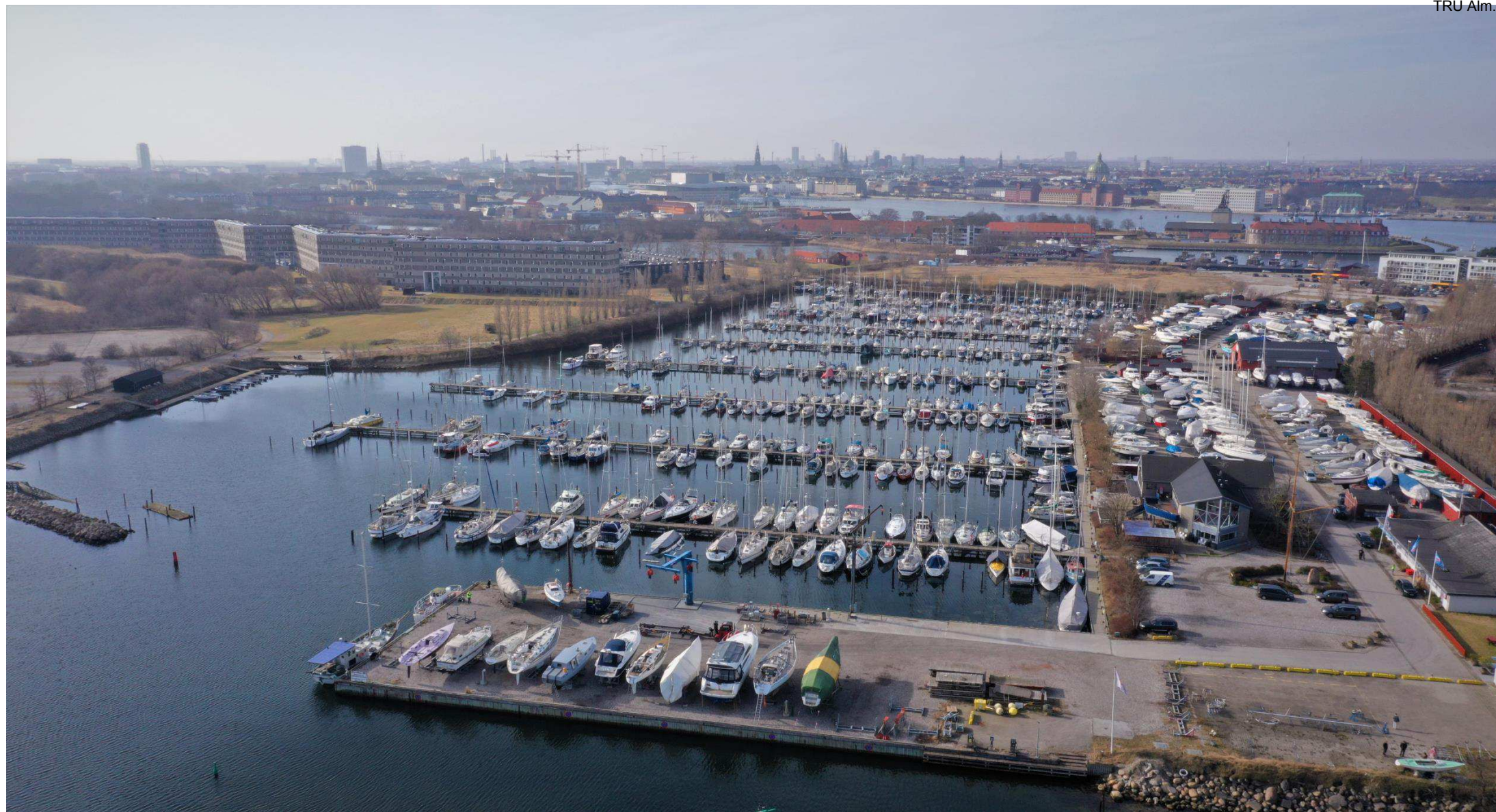
Margretheholms Havn - S/K Lynetten set fra øst og ind mod København