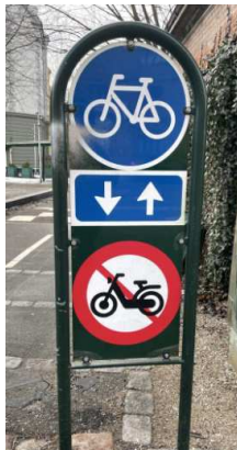
Figur 1

Et andet valg jeg to, var at vælge en 30 km/t version fremfor 45 km/t, da man så kunne køre på cykelstien og hellere ikke have problemer med at parkere, da den skal parkeres efter samme regler som en cykel der må parkeret ved cykelstativer samt på fortovej. (en 45 km/t skal jo følge reglerne for biler)