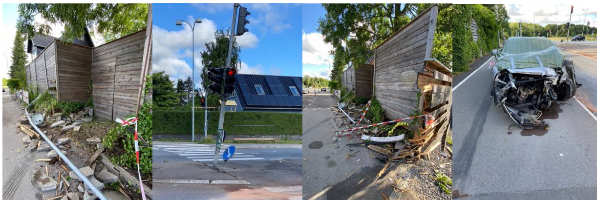
Fire foto fra ulykke i lyskrydset Jonstrupvangvej/Ballerupvej, d. 11.7.2020

https://ekstrabladet.dk/112/30-aarig-torpederer-lygtepaele/8200008?fbclid=IwAR1WIAkergSuNI4E1S5USqN-K_fS1ycjOeqvGhn6CDUXQ98cPyLUH152pg4