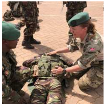
Instruktører fra Hjemmeværnet underviser kenyanske soldater i førstehjælp

Danmark vil arbejde for, at WPS-dagsordenen fremmes som en del af FN's reformarbejde, særligt gennem Generalsekretærens reformdagsordener på freds- og sikkerhedsområdet, Action for Peacekeeping (A4P) og sustaining peace-dagsordenerne. Det planlagte danske medlemskab af FN's Fredsopbygningskommission vil bl.a. muliggøre et substantielt dansk engagement og en styrket dansk stemme i FN's arbejde med kvinder, fred og sikkerhed. I mellemstatslige forhandlinger, hvor WPS-dagsordenen er under pres, vil Danmark ligeledes fremme en stærk og progressiv tilgang.