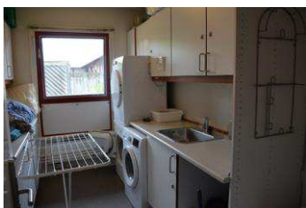
Vaskerum, anbringelsessted der ligger inde i en by