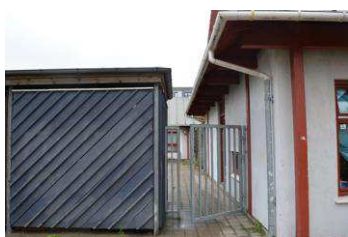
Port der kan låses, anbringelsessted der ligger inde i en by