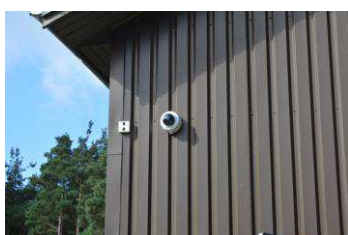
Videoovervågning, anbringelsessted der ligger på landet

Videoovervågningen bliver anvendt, når stedet konkret vurderer, at der er brug for det i forhold til de aktuelle problemer, ungegruppen på stedet har. Formålet med overvågningen er at