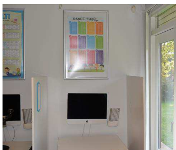
Undervisningslokale, anbringelsessted der ligger ude på landet

En af de unge, der går på den interne skole, der hvor hun er anbragt, fortæller, at hun er glad for, at skolen er tilrettelagt, så der er plads til de unges udfordringer: