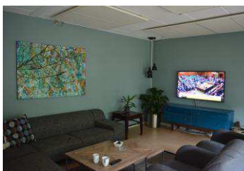
Opholdsrum, anbringelsessted der ligger i en by

De anbringelsessteder, der ligger inde i en større by, har til huse i en enkelt bygning som kan minde om et privat hjem. Fællesarealerne er udgjort af et køkken, en spisestue og tv-stue, og udendørsarealerne er en mindre have eller flisebelagt gård. Der er ikke de samme faciliteter på stederne. De fleste fritidsaktiviteter for de unge foregår derfor uden for anbringelsesstedernes matrikel. Stederne har udslusningslejligheder i nærheden, hvor de unge kan flytte hen som forberedelse på at skulle bo i egen lejlighed.