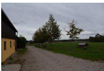
Omgivelser, anbringelsessted der ligger på landet