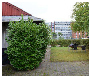
Udeareal, anbringelsessted der ligger i en by

Blandt de otte anbringelsessteder er der stor forskel i de fysiske rammer, både når det handler om størrelsen af anbringelsesstedet, typen af bygninger, og hvor anbringelsesstedet er placeret i forhold til land og by.