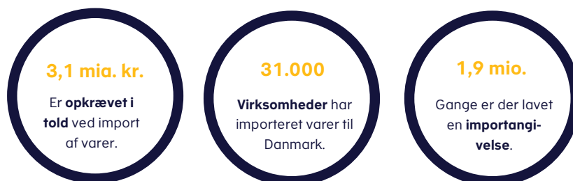
Figur 1. Nøgletal for opkrævningen af told i 2020