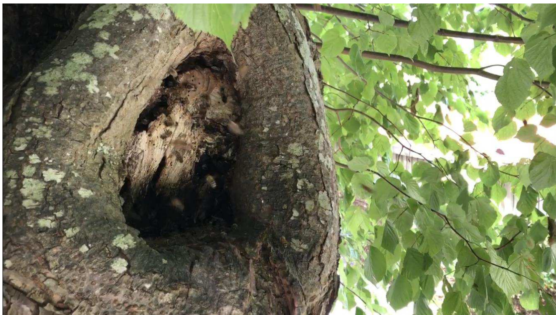
Honningbierne er naturligt hjemmehørende i Danmark. De hører oprindeligt til i skoven, hvor de som her etablerer sig i hule træer.

En stor del af det danske landskab er kulturlandskab og honningbierne er en del af den danske kultur. Gennem middelalderen og op i 1800-tallet var der mange honningbifamilier i Danmark. Honning, voks og mjød var vigtige produkter. Stort set hver gård havde bikuber og der var vildtlevende honningbifamilier i skovene. Under og efter 2. verdenskrig var der et meget højt antal (mere end 250.000) bifamilier i Danmark. Siden er bestanden til stadighed faldet. Ved Statens Biavlsvforsøg blev der under 2. verdenskrig lavet optællinger af bier i blomstrende frugtbuske, kløver- og lucernefrømarker. Optællingerne viste, at der dengang var mange honningbier, såvel som humlebier, enlige bier og svirreflugter som alle var med til at sikre bestøvning.