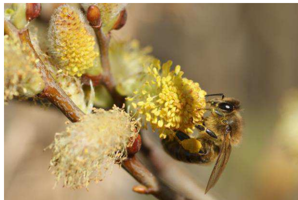
Det er naturligvis vigtigt, at vi gør mest muligt for at bevare den genetiske ressource i den oprindelige danske brune bi.

Man kan diskutere om man skal kalde honningbier for husdyr, men hvis man vil det må man også erkende, at det er et af de husdyr som er tættest på deres vilde ophav. Biavlere kan til dels påvirke sine bier, men der er meget af honningbiernes adfærd, man ikke kan styre.