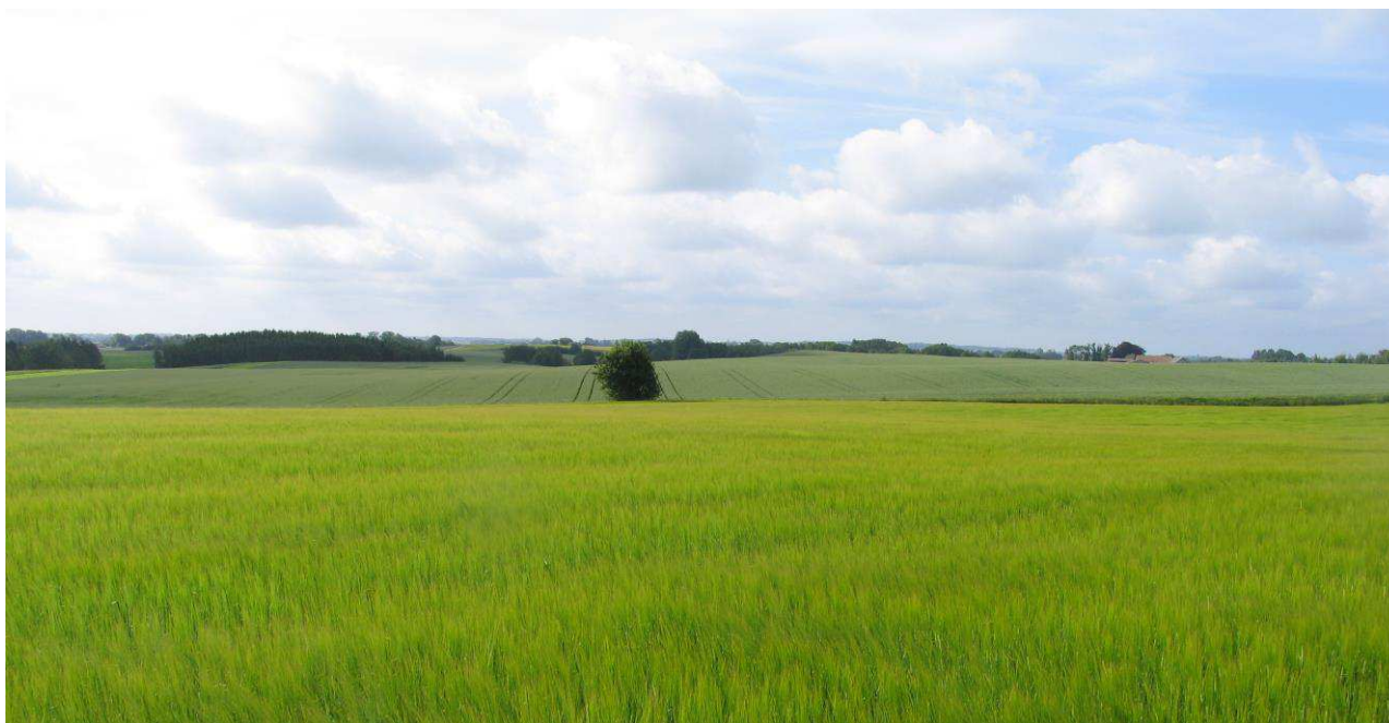
I Danmark sker der blandt andet tab af naturlige levesteder, når markskel, hegn og randzoner bliver nedlagt, hvilket fører til at mange redesteder og blomster går tabt.