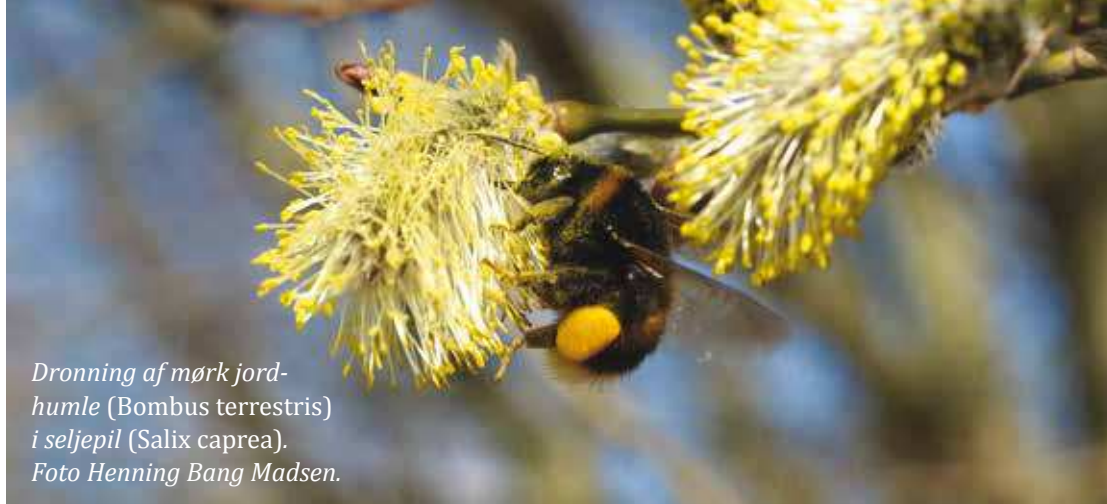
Dronning af mørk jord- humle (Bombus terrestris) i seljepil (Salix caprea).

medvirkende årsag til de store tab af honningbifamilier og til tilbagegangen for nogle af de øvrige biarter. Men for de vilde bier spiller mangel på egnede biotoper med såvel føde, som redepladser og materialer til redebygning sandsynligvis også en vigtig rolle.