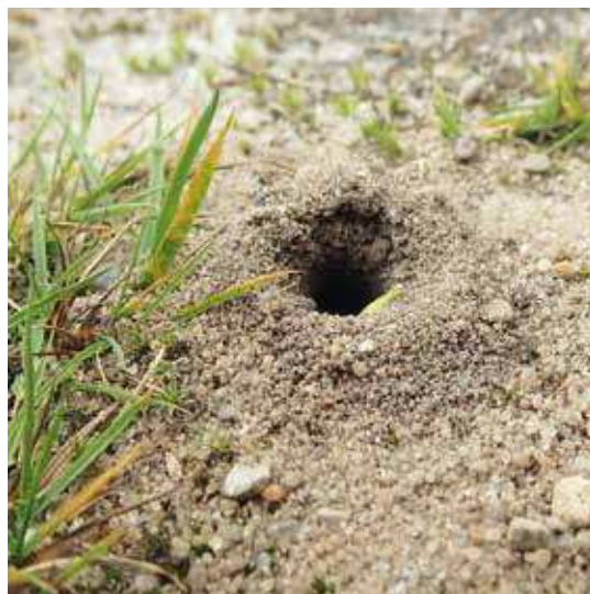
Figur 4. Redeindgang hos en jordboende bi, sandsynligvis en art af jordbi ( Andrena sp.).

Nogle enlige bier, særligt arter fra bugsamlerfamilien,