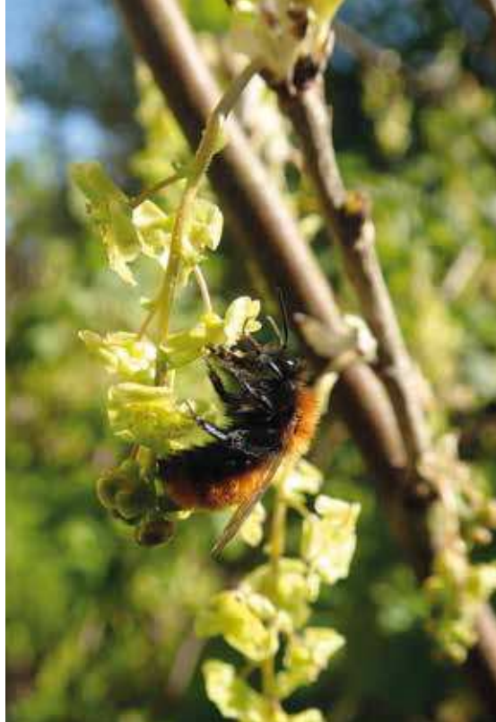
Figur 1. En mangfoldighed af bier: nogle vilde bier er meget iøjefaldende, f.eks. den flotte rødpsede jordbi ( Andrena fulva ) (foto t.v.), som om foråret besøger en lang række forskellige blomster Foto Yoko L. Dupont. Andre arter er mere uanseelige, f.eks. vejrbier, her bronzevejbi ( Halictus tumulorum ) (foto t.h.). Foto Henning Bang Madsen.