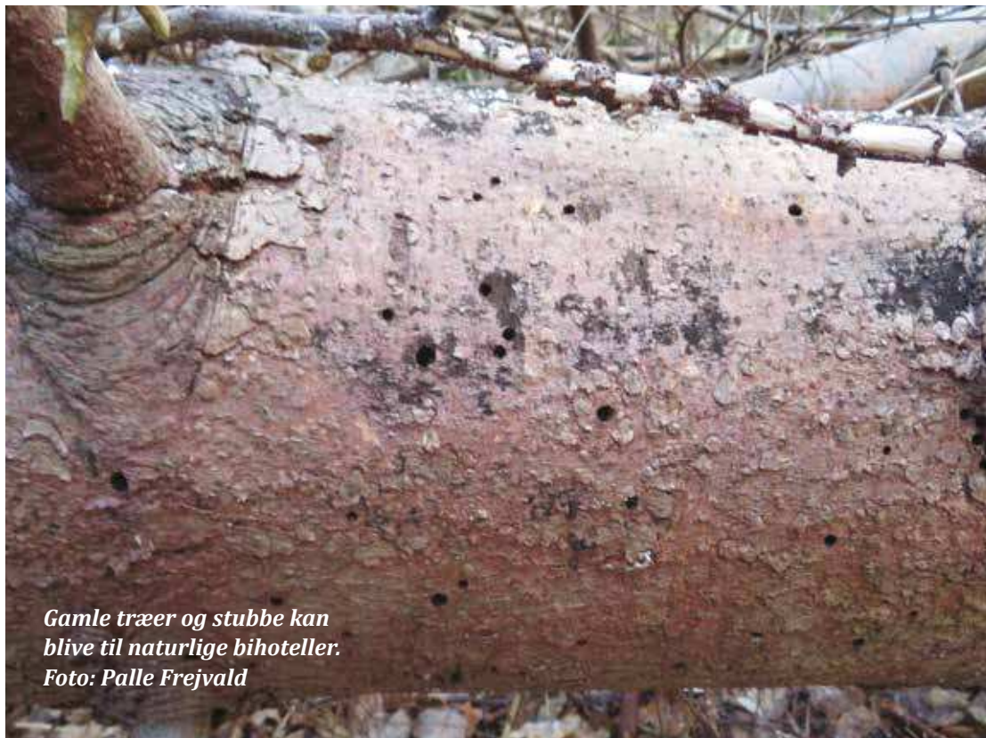
Gamle træer og stubbe kan blive til naturlige bihoteller.