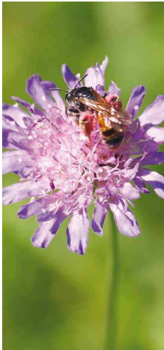
Figur 8. En hun af blåhatjordbi ( Andrena hattorfiana ), som er oligolektisk på blåhat ( Knautia arvensis ).

De fleste arter af vilde bier er knyttet til det lysåbne land, hvor de søger blomsterføde i både opdyrkede og udyrkede områder. Desværre kan der være langt mellem gode blomsterkilder i det danske landskab. Moderne landbrugsdrift dominerer landskabet med store marker, ofte med vindbestøvede afgrøder, som ikke har føde til bierne. Blomstrende ukrudt er i stor udstrækning sprøjtet væk i konventionelt dyrkede