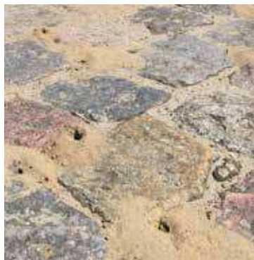
Figur 2. Pragtbuksebie (Dasygaster hirtipes) er en forholdsvis stor bi, hvor hunnerne har de karakteristiske rød-gule hårbørster, som kaldes "bukser", på bagbenene. Det er en almindelig sensommerbi, som kan lave store kolonier med hundreder eller tusinder af reder samme sted. Rederne bygges i jorden, typisk sammenstampet sandet jord, f.eks. på grusveje, gårdspladser, parkeringspladser og andre lignende steder. De er oligolektiske på gule kurvblomster, f.eks. kongepen og høgeurt.