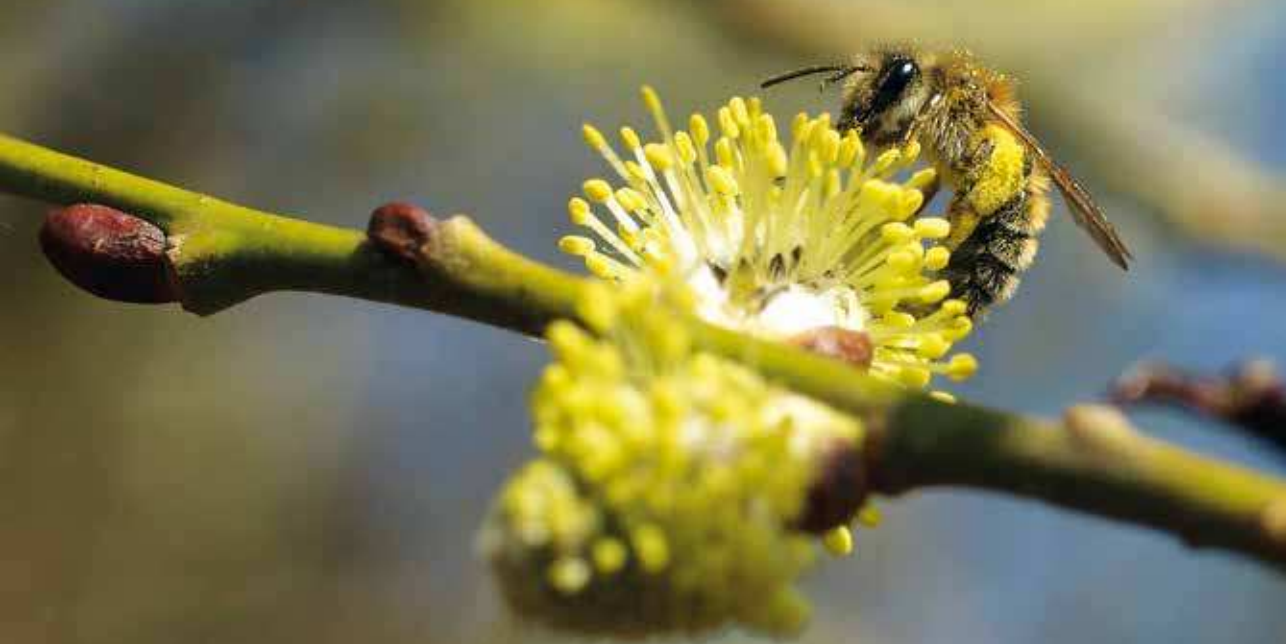
Figur 6. En hun af forårsjordbi ( Andrena praecox ), som er oligolektisk, og kun samler pollen ind på pil ( Salix spp.).

En gruppe af bier bygger slet ikke reder, men udnytter andre redebyggende biers møjsommeligt indsamlede proviant. Redesnylteren (også kaldet en kleptoparasit) trænger ind i værtens rede, og lægger sit eget æg, som klækker til en larve, der æder værtens bibrød. Blandt humlebierne findes snyltehumler, som er nært beslægtede med redebyggende humlebier, men som ikke selv bygger bo. Den parrede snyltehumlehun (pseudodronning) trænger ind hos den redeboende vært, fortrænger eller undertrykker den retmæssige dronning, lægger æg, og udnytter kolonien til at opfostre sit eget afkom. Den snyltende levevis er udviklet i flere forskellige familier af bier, og værterne findes