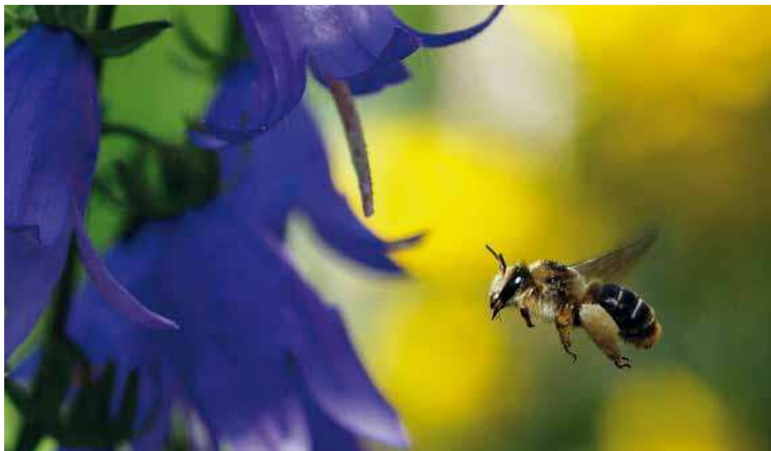
Figur 7. En hun af rødhålet høstbi ( Melitta haemorrhoidalis ), som er oligolektisk på klokkeblomster ( Campanula spp.).

Nogle bier er kræsne i forhold til pollen, som larverne udvikles på. Oligolektiske bier er specialister, som kun samler pollen fra en bestemt gruppe af planter, oftest en planteslægt eller –familie. En række arter, bl.a. mange arter af jordbier ( Andrena spp.) er oligolektiske på pil ( Salix spp.), og deres aktivitetsperiode er nøje synkroniseret med pilens blomstring (se figur 6). Men andre er oligolektiske på kurvblomster (f.eks. pragtbuksebi ( Dasypoda hirtipes )), klokkeblomster ( Campanula spp.) (f.eks. høstbi Melitta haemorrhoidalis (se figur 7)