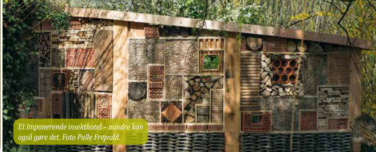
Et imponerende insekthotel – mindre kan også gøre det.