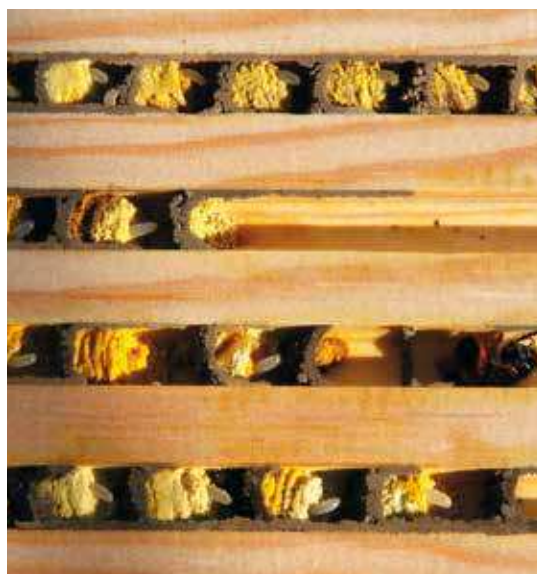
Figur 5. Reder af rød murerbi ( Osmia bicornis ) i et bihotel, hvor gangene er 8 mm brede. Hver yngelcelle indeholder bibrød (nektar og pollen) med et æg ovenpå. Cellerne afsluttes med en væg lavet af mudder og spyt. I anden gang nedefra sidder der en moderbi. Det er tydeligt at se de røde hår på bagsiden af underkroppen, som hun bruger til at transportere pollen.