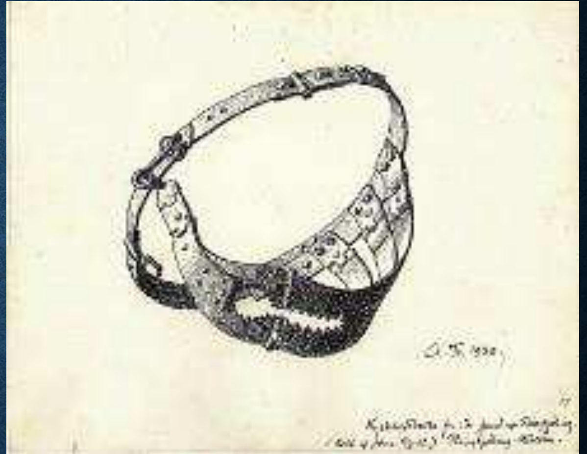
Achton Friis, Tegning af kyskhedsbælte, 1930