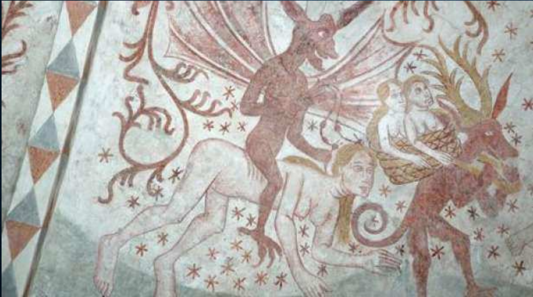
Kalkmaleri fra 1425-1450 fra Højelse Kirke