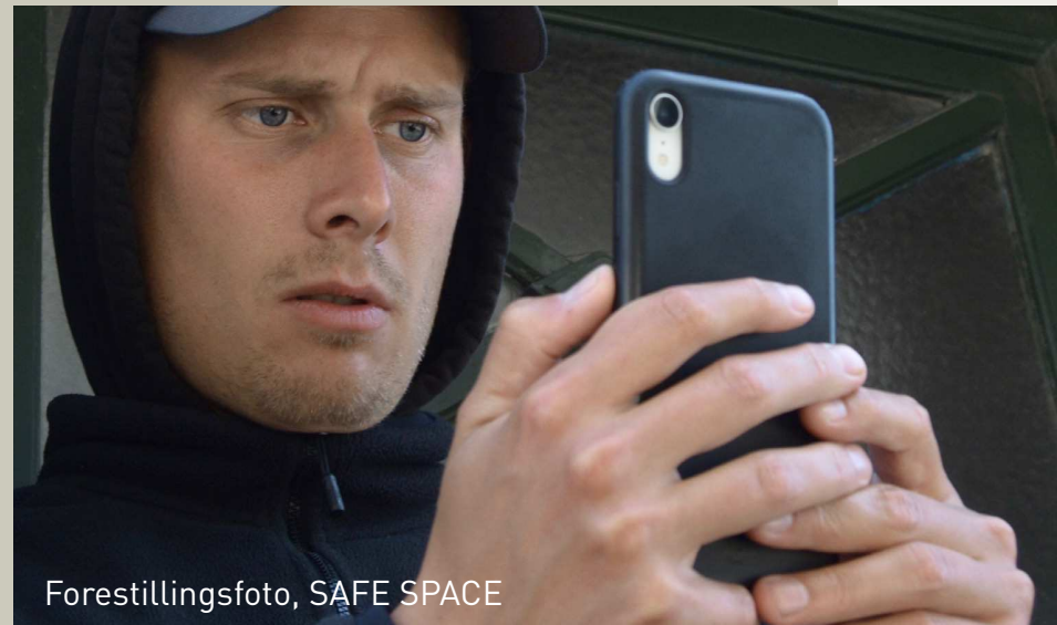
Forestillingsfoto, SAFE SPACE

Løbende: Administration, kommunikation og faciliteter hos Teater V.