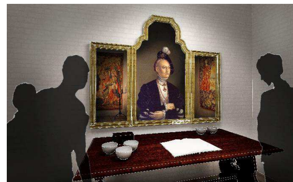
Visualiseringer: Nyborg Slot, Moesgaard Museum