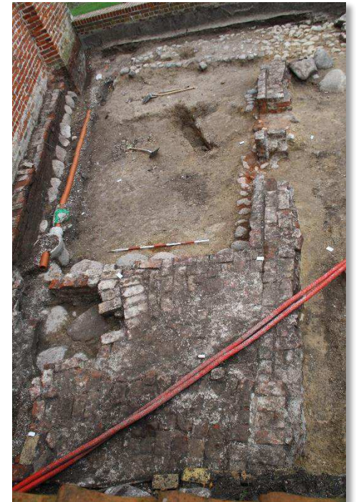
Arkæologiske levn ved den nordlige del af Kongefløjen