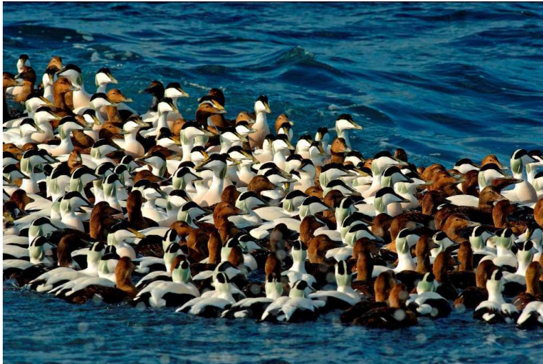
Op til en kvart million ederfugle opholder sig i Smålandsfarvandet.

Set ud fra hensynet til havfuglene, er det mindst to tredjedele af det danske søterritorium, det er forholdsvis uproblematisk at bygge havvindmølleparker i. Til gengæld er den resterende tredjedel af meget stor international betydning for flere millioner havfugle, som er helt afhængige af de danske farvande som raste-, fælde- og overvintringsområder. Det er de, fordi de danske farvande er forholdsvis lavvandede og tillige isfrie i de fleste vintre – dvs. de samme forhold som gør dem ideelle til at bygge havvindmøller.