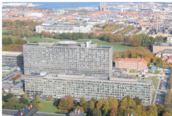
Helikopterlandingsplads på taget af Rigshospitalet.

Heller ikke undskyldningen om sikkerhed ved helikopterlanding lyder troværdig. Helikoptere bruges i dag til mange formål. Offshore industrien bruger dem særdeles intensivt. Og her er landingspladserne meget små. De ligger enten udkræget fra platformen eller på et mindre areal af dækket på seismik- eller forsyningskibe. Mon ikke det skulle være muligt at finde en afkrog på kasernearealet til et sådant formål?