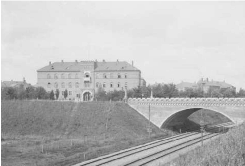
Svanemøllen Kaserne 1900-1910

Området var tidligere del af Vognmandsmarken, hvor vognmandslavets heste græssede. I 1893 overgik arealet til Ingeniørtropperne. Arealets trekantede form skyldes anlæggelsen af Nørrebrobanen, Kystbanen og Frihavnsbanen omkring år 1900.