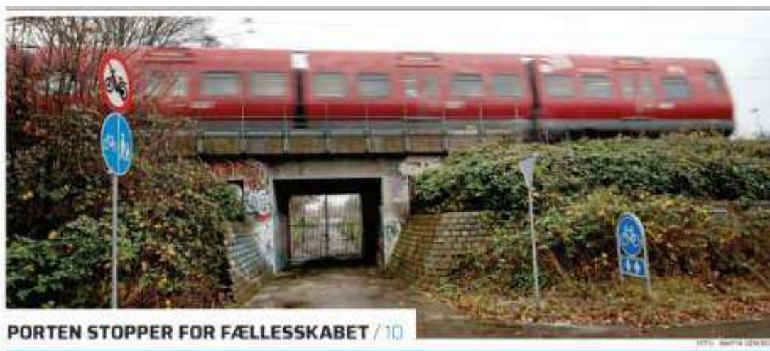
Her ses fra den modsatte side tunnelunderføringen og gitterporten på Ringbanen samt resterne af den tidligere stiforbindelse med belægning.

Så flytter Forsvaret – på trods af Bedre Balance politikken - ikke FE og Forsvarsakademiet til provinsen, så er den næstbedste løsning reetablering af den nedlagte stiforbindelse. Det kræver blot fjernelse af gitterporten under Ringbanen og noget supplerende skiltning.