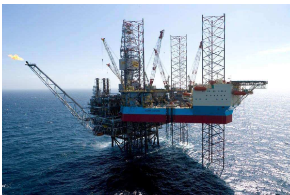
Helikopterlandingsplads på platformen Maersk Inspirer.

Hvis vi tager FE først, så har FE i rigtig mange år – her inkluderet perioden under den kolde krig – haft adresse på Kastellet. Tilsyneladende uden at det har voldt problemer med adgang for befolkningen i området omkring bygningerne. Havde det været tilfældet, så var FE nok fraflyttet Kastellet for adskillige årtier siden. Det er svært at forstå, hvordan situationen skulle ændre sig, fordi FE fordi flytter til den nye adresse på Svanemøllen Kaserne. Den kolde krig er forlængst forbi, og potentielle fjender er både blevet færre i antal, og grænserne er flyttet længere væk.