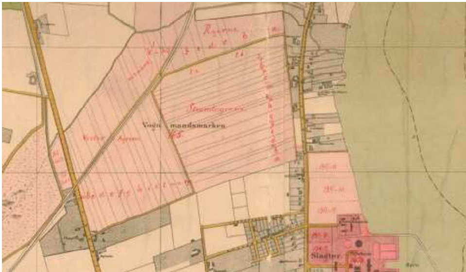
Kortudsnit 1879

Området var tidligere del af Vognmandsmarken, hvor vognmandslavets heste græssede. I 1893 overgik arealet til Ingeniørtropperne. Arealets trekantede form skyldes anlæggelsen af Nørrebrobanen, Kystbanen og Frihavnsbanen omkring år 1900.