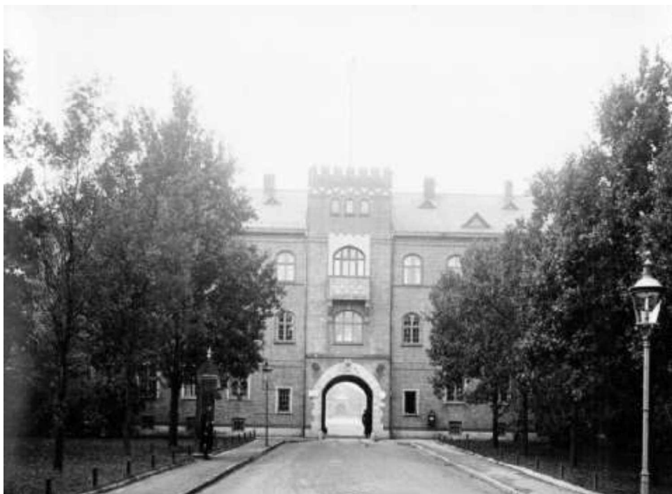
Svanemøllens Kaserne 1922