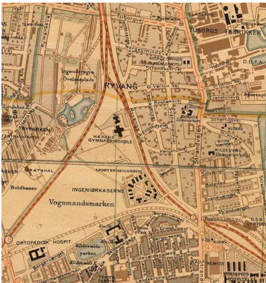
Kortudsnit 1939 fra historiskatlas.dk

Hærens Gymnastikskole ses som den korsformede bygning på kortet fra 1939 nedenfor. Hele idrætsanlægget indgår i de kulturhistoriske bevaringsinteresser.