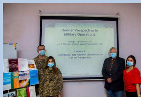
Billede 15: Undervisning i kønspektiver i den militære opgaveløsning ved NDU i Ukraine

Fremadrettet vil Fonden i højere grad tænke dagsordenen ind i tilrettelæggelsen af nye programmer og styrke engagementer, der flugter med prioriteterne for den nye danske handlingsplan.