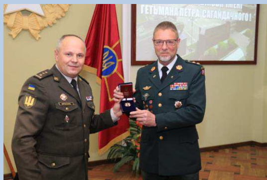
Billede 8: Rådgiveren tildeles ukrainsk æresmedalje (Badge of Honour).

Som en del af den danske støtte til Ukraine inden for rammerne af Fonden har det danske forsvar i 2020 haft en rådgiver udsendt ved skolen. Rådgiveren har været med til at udvikle en moderne videreuddannelse for officerer i tråd med NATO-standarder og har ydet en meget anerkendt støtte til sproguddannelsen. Den 9. december 2020 blev rådgiveren tildelt den ukrainske forsvarsministers æresmedalje Badge of Honour for sin indsats ved skolen.