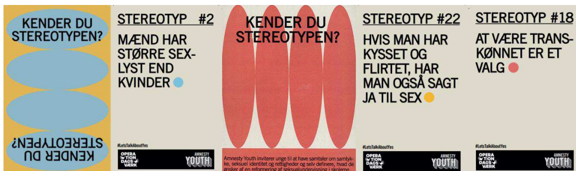
1. Kortspillet "kender du stereotypen?" der inviterer de unge til at starte samtaler omkring sex.

I efteråret har ansatte og aktivister fra Amnesty Youth og Operation Dagsværk sat fokus på samtykkebaseret seksualundervisning under kampagnen #LetsTalkAboutYes. Vi har afholdt møder med politiske ordførere, elevbevægelsen og ungdomspartier. Vi har debatteret problemer, krav og ønsker ift. seksualundervisningen i Radio4, Jyllands-Posten og Femina, og talt med tusindvis af gymnasieelever på workshops, foruden 3000 unge på Roskilde Festival.