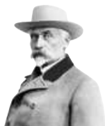
VIGGO HØRUP (1841-1902) STIFTER AF POLITIKEN I 1884

7 læserbreve og debatindlæg handlede om minkgate