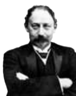
EDVARD BRANDES (1847-1931) STIFTER AF POLITIKEN I 1884