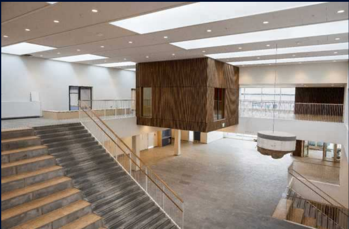
Det store atrium i politiets nyligt færdiggjorte uddannelsescenter i Vejle.