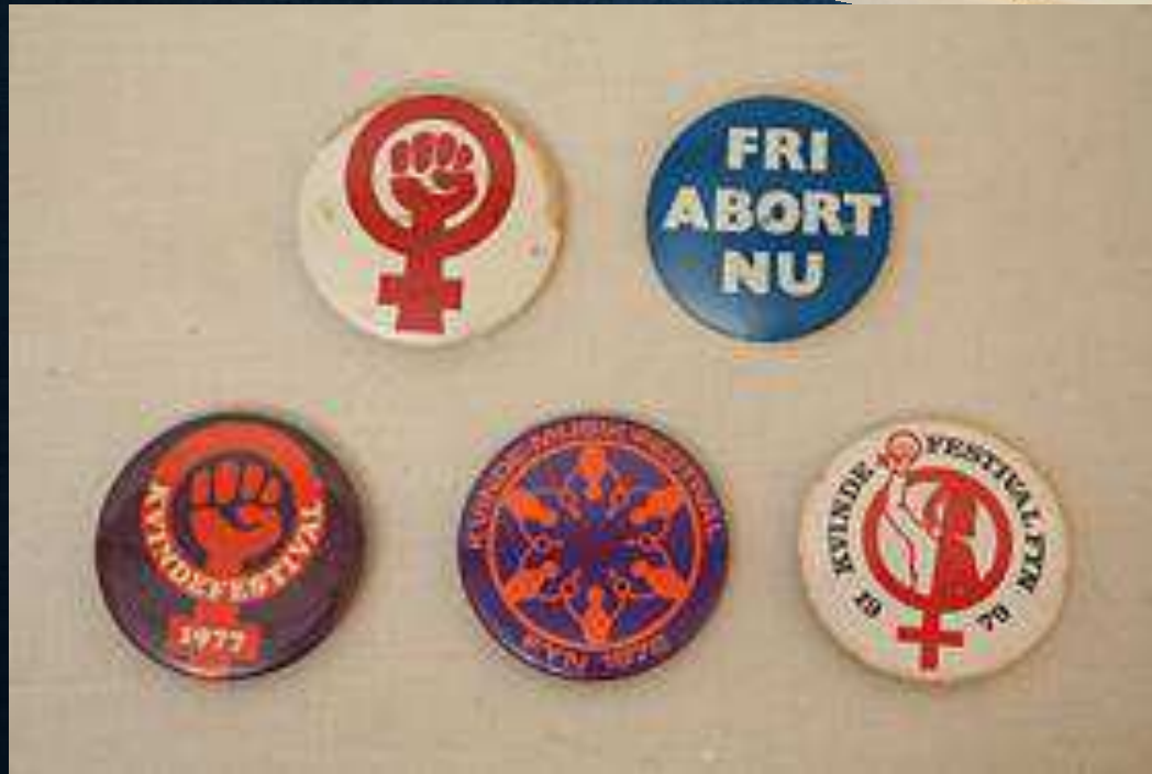
Genstande fra Kvindemuseets samling