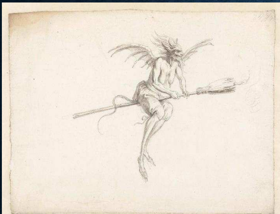
Cornelis Saftleven, Uden titel (heks på kost), 1617-1681 Rijksmuseum Amsterdam