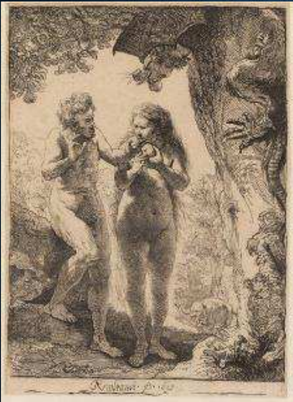
Rembrandt van Rijn, Adam og Eva, 1638