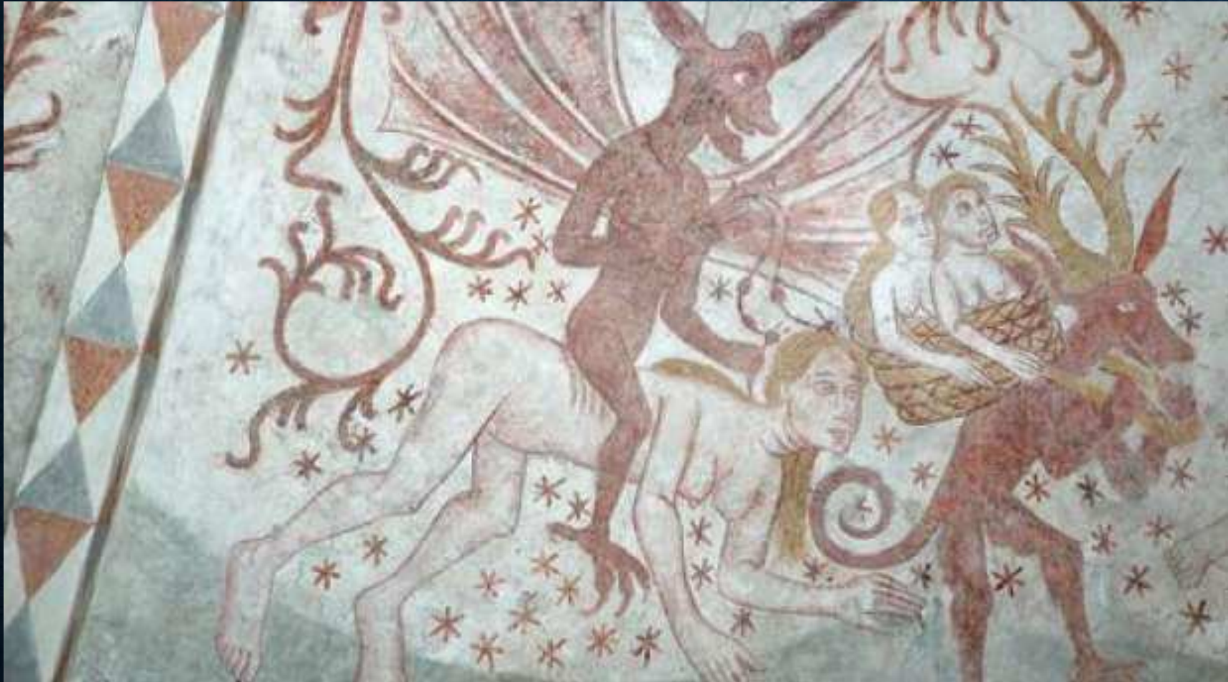
Kalkmaleri fra 1425-1450 fra Højelse Kirke