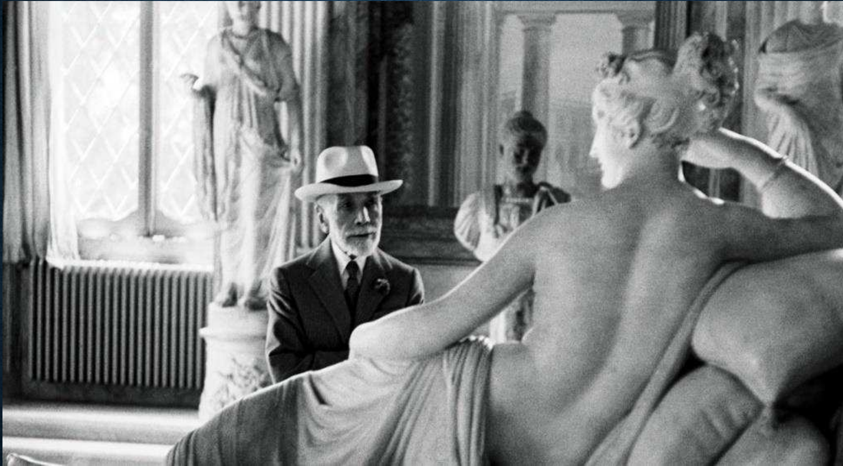
Bernhard Berensen, amerikansk kunstsamler, ser på skulpturen Pauline Borghese af Antonio Canova, Rom, 1955.