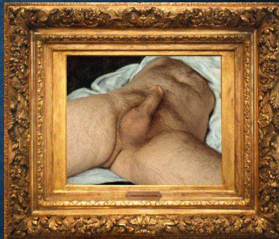
ORLAN, l'Origine de la Guerre , 1995