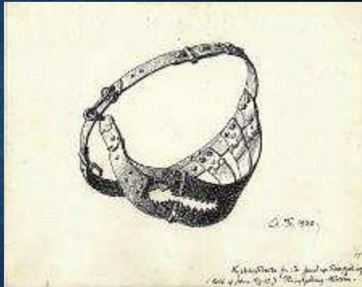
Achton Friis, Tegning af kyskhedsbælte, 1930