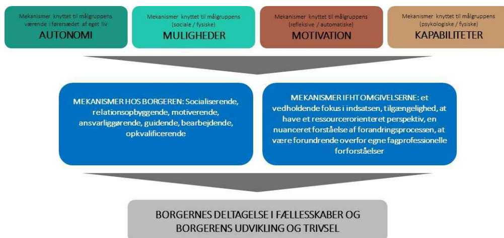
Figur 3: Forandringsdrivkræfter og mekanismer i indsatsen

I figuren til højre ses nogle af de forandringsdrivkræfter og mekanismer, som er relationsopbyggende, motiverende, guidende, rådgivende og opkvalificerende, og som