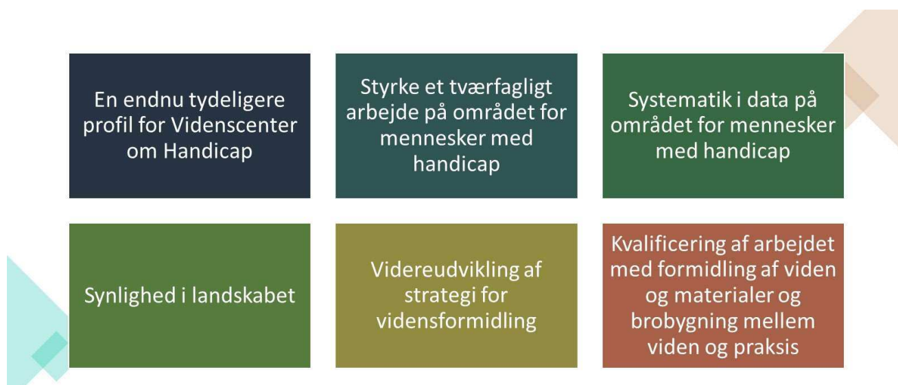
Figur 4: Overblik over fokusområder for det fremadrettede samarbejde

I figuren nedenfor ses et enkelt overblik over de seks forslag til tiltag og fokusområder i VOH’s fremadrettede arbejde. Efterfølgende er hvert enkelt tiltag og fokusområde udfoldet.