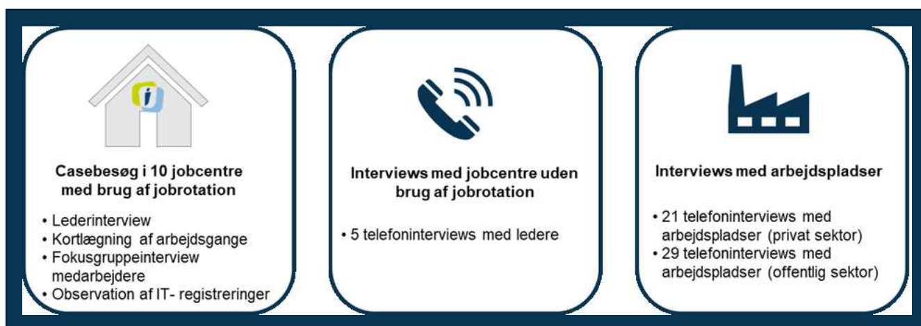
FIGUR 3.1. OVERBLIK OVER EVALUERINGENS DATAKILDER

Evalueringen bygger på et kvalitativt undersøgelsesdesign , der primært består af interviews, desk research og observation. 15 jobcentre og 50 arbejdspladser er inddraget i dataindsamlingen med det formål at opnå en dybdegående indsigt i de centrale gevinster og barrierer, som jobcentre og virksomheder forbinder med jobrotationsordningen.