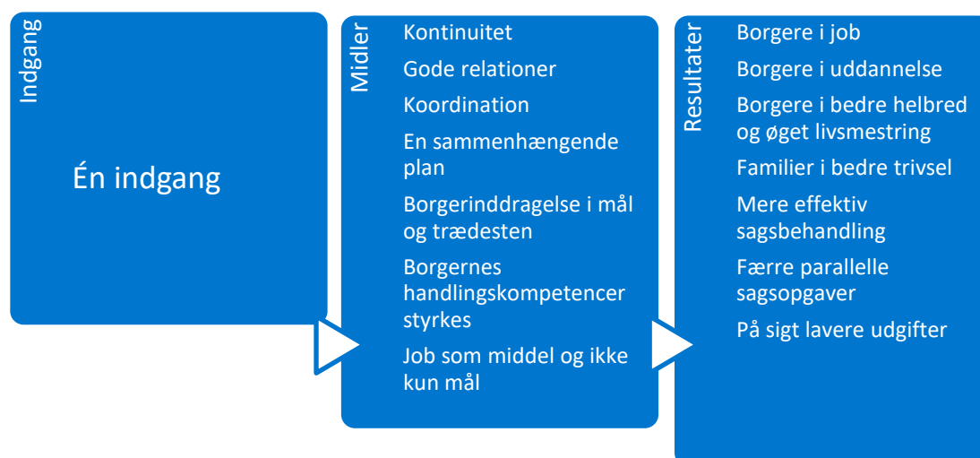
Figur 1.2 Forsøgets underliggende forandringsteori

Med henblik på at kunne fokusere evalueringen og producere relevant viden har VIVE formuleret en forandringsteori, som VIVE vurderer, har ligget bag frikommuneforsøget. Forandringsteorien afspejler perspektiver i litteraturen, som kommunerne har været inspireret af. Den trækker dermed på viden om netværkets og de enkelte kommuners antagelser og erfaringer, men den er formuleret i et mere generelt sprog og er ikke nødvendigvis en en-til-en-afspejling af, hvad der har været tænkt i hver enkelt kommune. Den er grafisk illustreret nedenfor: