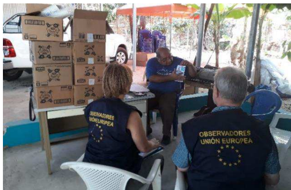
Billede 3: Dansk valgobservatør (th) og kollega på besøg hos et af partiet GANA's kampagnekontorer i El Salvador under præsidentvalget i februar 2019.

I 2019 var der udsendt 186 valgobservatører til bl.a. Ukraine, Mozambique, Tunesien og Sri Lanka. De observerer om internationale retningslinjer for afholdelse af valg bliver overholdt f.eks. ved at besøge kampagnekontorer.