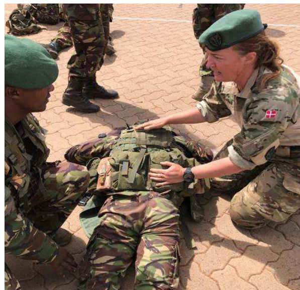
Billede 7: Danske instruktører fra Hjemmeværnet underviser kenyanske styrker forud for udsendelse til AMISOM på Kenyan School of Infantry i Isiolo, Kenya.

Hjemmeværnet har i tæt samarbejde med British Peace Support Team (BPST) fortsat trænet kenyanske styrker før, de bliver udsendt til Den Afrikanske Unions mission i Somalia (AMISOM).