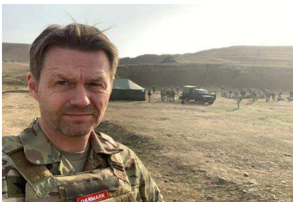
Billede 12: Hjemmeværnets rådgiver ved JTEC inspicerer georgiske bataljoner under en feltskydning i et øvelses- og skydeområde.

Som en del af NATO's Defence and Related Security Capacity Building Initiative finansierer Fonden udsendelse af danske rådgivere. I 2019 blev det besluttet, at Danmark skal lede et krisestyringsprojekt i Georgien, der har til formål at bidrage til at udvikle den civile krisestyringskapacitet i Georgien. Det langsigtede mål er, at Georgien bliver bedre i stand til at håndtere f.eks. skovbrande eller oversvømmelser. Derfor blev en dansk rådgiver fra Beredskabsstyrelsen udsendt, hvor han i tæt samarbejde med georgiske og internationale partnere skal identificere de konkrete områder, hvor den georgiske krisestyringskapacitet kan forbedres.