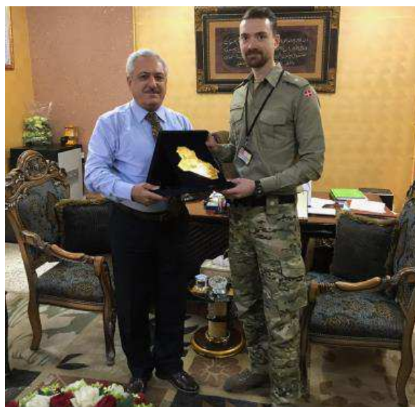
Billede 6: Møde mellem vicechefen for civilt personale i det irakiske forsvarsministerium og den danske HR-rådgiver til NMI.

I Irak har situationen i de tidligere ISIL-besatte områder (nordlige og vestlige) været relativt rolig. Til gengæld var der fra oktober 2019 omfattende demonstrationer i Bagdad og i de shiamuslimsk-dominerede byer i de sydlige provinser. Udviklingen understreger, at skrøbeligheden i Irak ikke er isoleret til de tidligere besatte områder, og at stabiliseringen i Irak ikke er fuldendt.