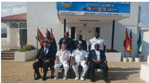
Billede 10: Deltagerne fra dialogmøde foran Det Maritime Overvågningscenter for Ghana og Nigeria, på OSU Castle (Christianborg), Ghana.

rådgivning af medarbejdere ved Multinational Maritime Coordination Centre (MMCC) i Accra (Ghana).