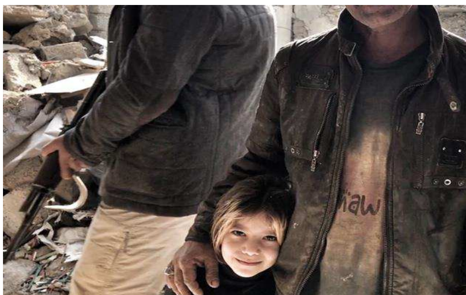
Billede 13: Pige med sin far, Mosul, Irak.

I 2020 vil Freds- og Stabiliseringsfonden i alt have en ramme på 505,4 mio. kr., hvoraf 94,2 mio. kr. kommer fra Forsvarsministeriet, mens Udenrigsministeriet bidrager med 400 mio. kr. ODA samt 11,2 mio. kr. i non-ODA.