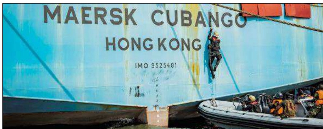
Billede 2: Ghanesiske specialstyrker træner på MÆRSK CUBAN-GO i Lagos, Nigeria.

Som et nyt indsatsområde blev en dansk rådgiver fra Beredskabsstyrelsen i 2019 udsendt til Georgien, hvor rådgiveren er i gang med at identificere områder, hvor man kan styrke den georgiske kapacitet til at håndtere krisesituationer.