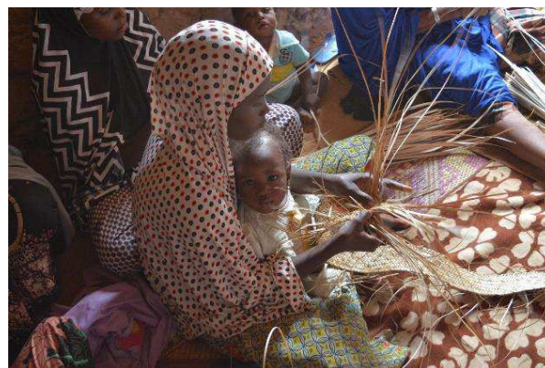
Billede 8: Fredsopbygningsfonden har i udvælgelsen af støtte til projekter et særligt fokus på empowerment og inddragelse af kvinder og unge i fredsopbygning.

FN's Fredsopbygningsfond arbejder for stabilisering af lande og regioner, der har været, er eller kan blive ramt af voldelige konflikter. Det sker via hurtig, fleksibel og risikovillig finansiering af konfliktløsnings- og stabiliseringsindsatser.