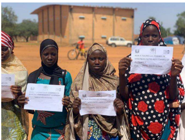
Billede 9: I Niger arbejder Fredsopbygningsfonden med forebyggelse af voldelig ekstremisme og empowerment af kvinder og unge.

Indsatserne fokuserer bl.a. på at opbygge kompetencer og selvtillid hos kvinder og unge til at tage del i arbejdet med konfliktforebyggelse og fredsopbygning i deres lokalsamfund.