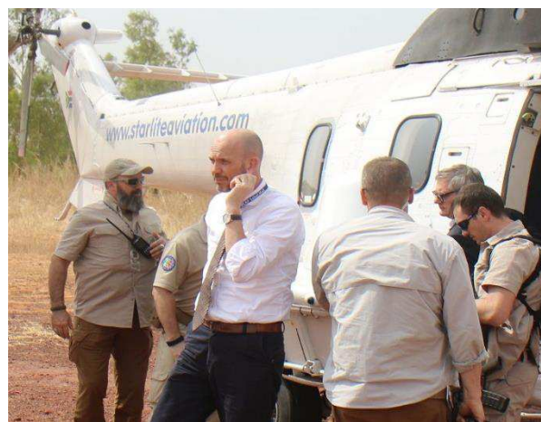
Billede 4: Dansk udsendt i EUCAP Sabel Mali på vej til regionen Ségou i Mali i forbindelse med indvielsen af et nyt situationscenter.

Derudover udsender Rigspolitiet også politiinstruktører til kortvarige undervisningsopgaver i bl.a. Irak. I 2019 udsendte de 48 politiinstruktører, hvilket samlet set betyder, at Rigspolitiet udsendte 85 personer til opgaver i udlandet.