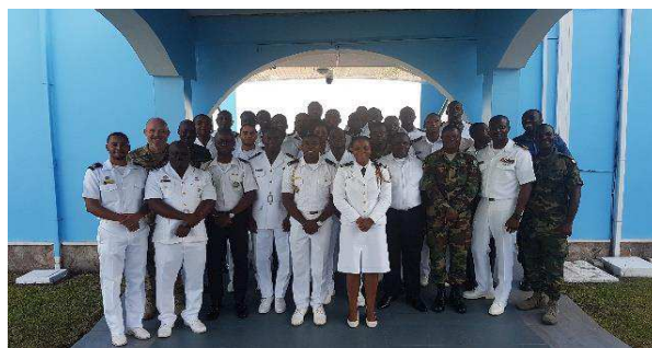
Billede 11: Kursister på 'Kofi Annan International Peacekeeping Training Centre'.