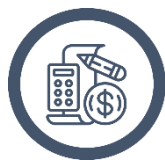
Kapital og risikovillige investeringer