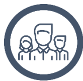
Mentorordninger og strategisk samarbejde