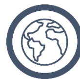
Internationalisering og globale vækstmuligheder