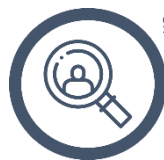
Rekruttering og talentudvikling i start-ups

På baggrund af forskellige oplæg og drøftelser i Iværksætterkommissionen er der udarbejdet en række politiske anbefalinger. Alle forslagene vil umiddelbart kunne implementeres. Nogle af forslagene vil kunne få en tydelig effekt og gennemslag her og nu. For andre forslag gælder det, at den store effekt vil