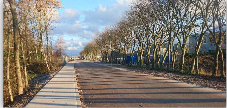
Eksempel på den nye stiuformning