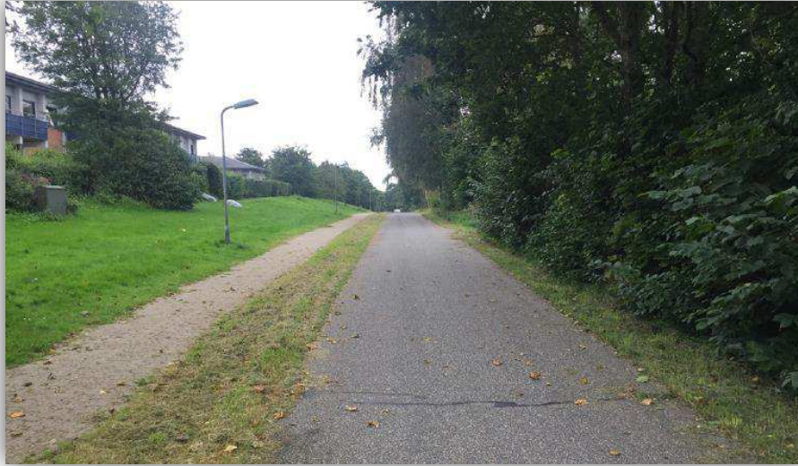
Eksempel på tidligere stiuformning