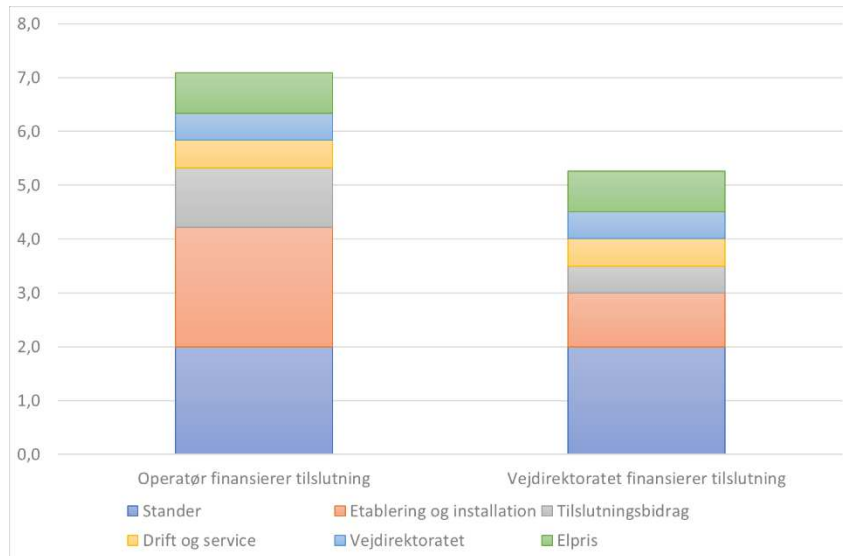
Figur 1. kWh-prisen ved aktuel udnyttelsesgrad

Anm.: Ekskl. Udgifter til kundeservice, udvikling af betalingsløsninger, integration mod andre udbydere mv. Desuden ingen betaling for politisk og teknologisk risiko.