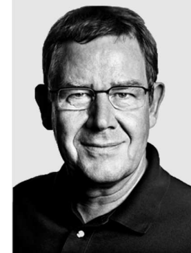
POUL NYRUP RASMUSSEN