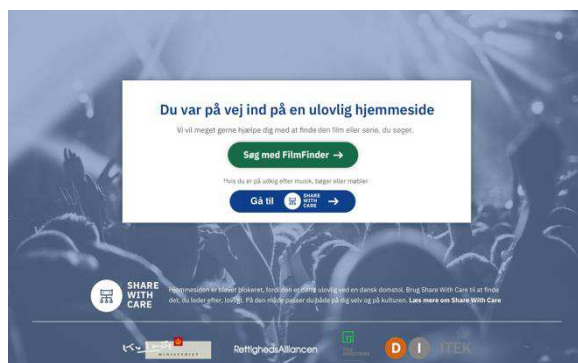
(Billede 1: Blokeringskilt på ulovlig side)