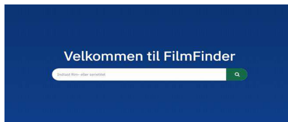
(Billede 2: Søgemaskinen FilmFinder)

Blokeringsværktøjet bliver dog i stigende grad udfordret af antallet af ulovlige tjenester, men også af den kreativitet, der lægges for dagen i form af adresseskift og andre tekniske omgørelser.