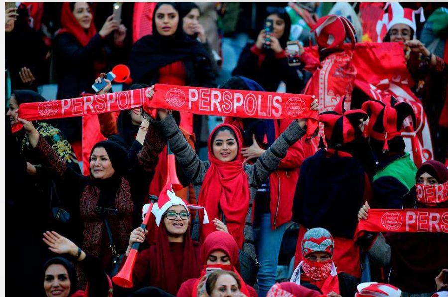
Kvinder på stadion i Teheran, 2018