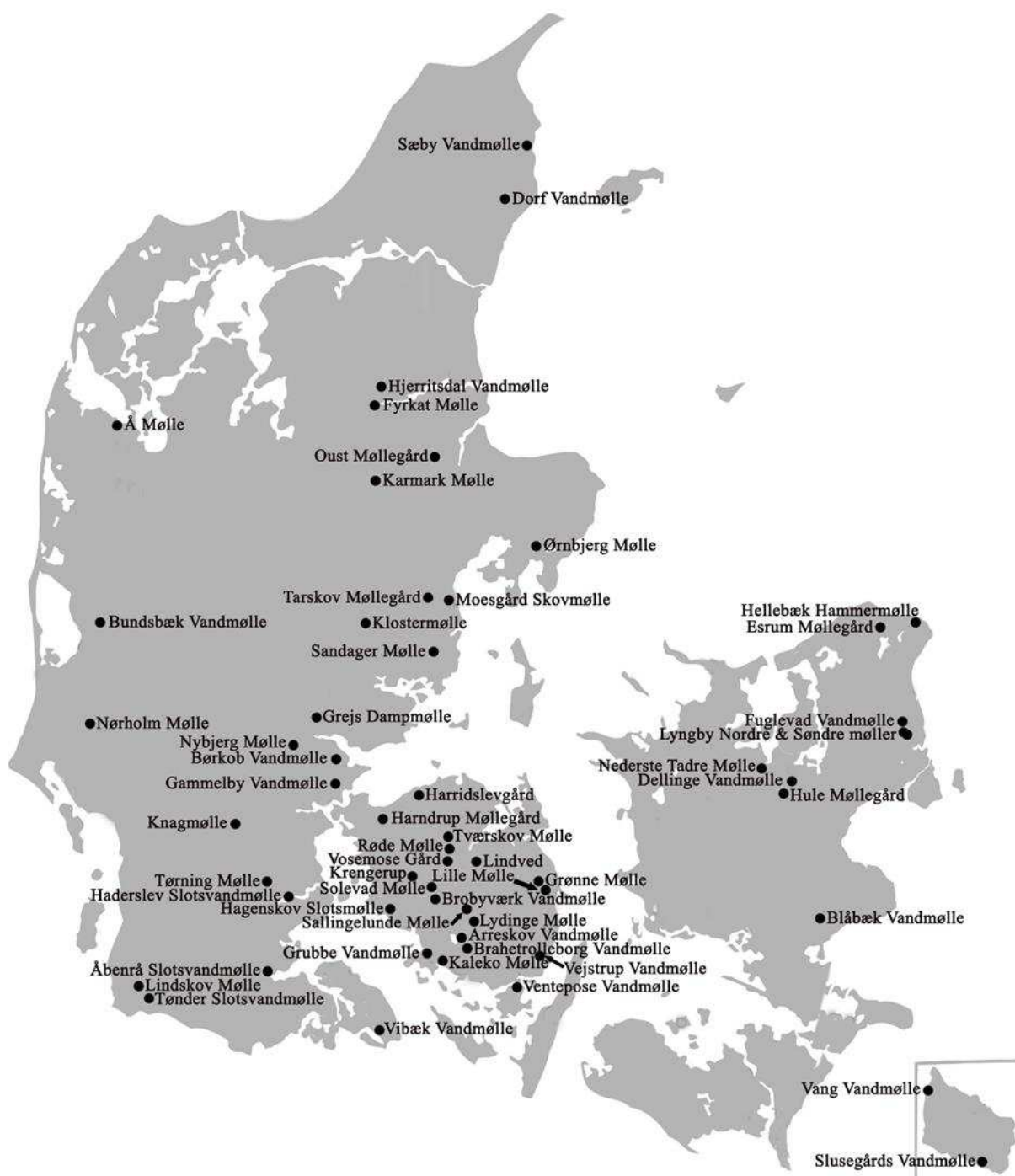
Oversigt over de 56 bygningsfredede vandmøller, 2020, Slots – og Kulturstyrelsen.