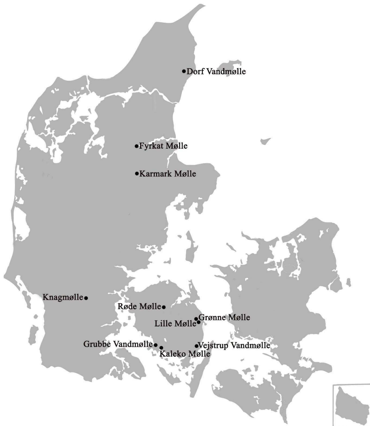
Oversigt over de sidste 10 intakte, fredede vandmøller.