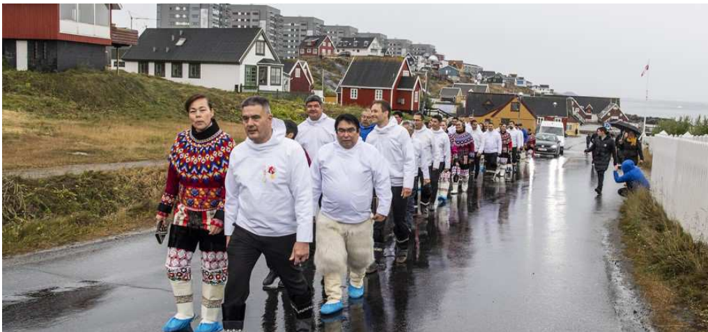
Inatsisartutåret indledes med procession.

Samlingen varer til 25. november 2020 og er forlænget med en vintersamling, der starter den 16. februar og slutter den 2. marts 2021.