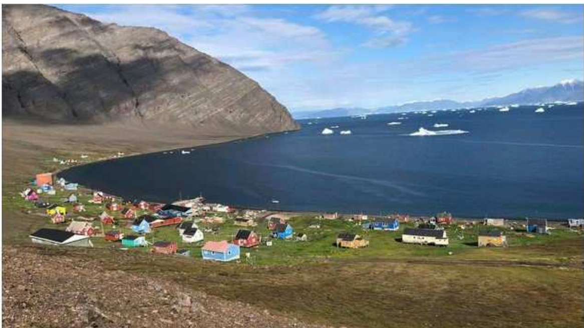
Illorsuit ved Uummannaq.

Mens Nuugaatsiaq blev hårdt ramt af tsunamien, forårsagede den kun mindre materielle skader i Illorsuit. De nationale geologiske undersøgelser for Danmark og Grønland, GEUS, har imidlertid vurderet, at der fortsat er stor risiko for fjeldskred i området, hvorfor Naalakkersuisut har besluttet, at de to bygder holdes lukket.