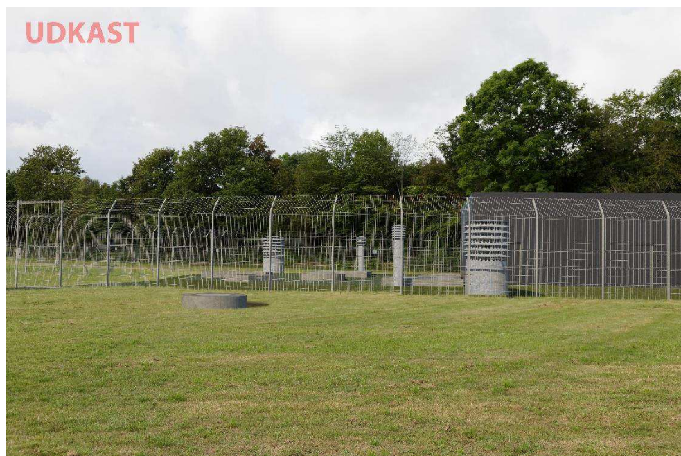
Figur 5-1 Visualisering af overjordiske konstruktioner ved skakten, hvor det øverste billede viser de nuværende forhold og det nederste billede viser en mulig udformning og placering af teknikbygning, adgangsvej, dæksler og udluftningsrør.