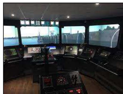
Den dansk finansierede simulator har udsyn 360 grader.

Blandt aktiviteterne i 1. halvår af 2019 er Forsvarets bidrag til yderligere udbygning af den dansk donerede bro- og navigationssimulator til den kenyanske flåde. Simulatoren er blevet udbygget med supplerende kommunikationsudstyr med henblik på at udvikle Kenya Navy Training College til et regionalt "Center of Excellence" for maritim træning. Herudover videreføres støtten til den kenyanske flåde med henblik på at sikre, at den kenyanske flåde bliver i stand til at udføre myndighedshåndhævelse til søs, herunder at kunne imødegå trusler fra pirateri og anden maritim kriminalitet. I tillæg hertil har danske instruktører bidraget til missionsforberedende uddannelse af kenyanske og ugandiske styrkebidrag til den Afrikanske Unions mission i Somalia, AMISOM.