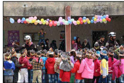
Dansk støtte til White Helmets i Syrien.

Det regionale stabiliseringsprogram for Syrien og Irak (2019 – 2021) har et overordnet formål om at bidrage til en reduktion af regional usikkerhed, terrorisme, migration og den længerevarende flygtningekrise. For at stabilisere situationen i Irak og styrke freden er der i 1. halvår af 2019 indgået aftaler med FN om ny dansk støtte til minerydning, genetablering af strategisk infrastruktur, jobskabelse, forsoningsindsatser og gennemførelse af sikkerhedssektorreformer. Aftaler om yderligere støtte forventes indgået i 2. halvår.