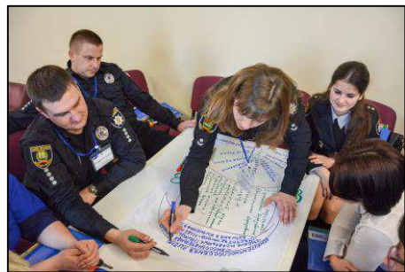
UNDP Recovery and Peacebuilding Programme.

Herudover har Danmark gennem UNDP's 'Recovery and Peacebuilding Programme' bidraget til at styrke den lokale sikkerhed og sammenhængskraft omkring den såkaldte kontaktlinje. Det sker gennem kapacitetsopbygning af både borgergrupper og lokale myndigheder med henblik på at kunne levere bedre borgerservice og sikkerhed. Desuden støttes driften af to centre for juridisk rådgivning, der i 1. halvår af 2019 har rådgivet godt 12.000 personer, hvoraf ca. 60 pct. var kvinder.