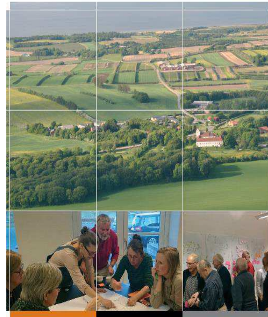
Procesplan for gennemførelse af multifunktionel jordfordeling