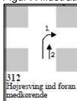
Figur X Illustration af ulykkesituation 312

En nærmere analyse viste, at omkring 88 % af de ulykker de "unge" er involveret i inden for hovedsituation 3 omfatter ulykkesituation 312 (se figur 2). I næsten alle tilfælde (98%) kører den "unge" ligeud på ulykkestidspunktet (element 2).