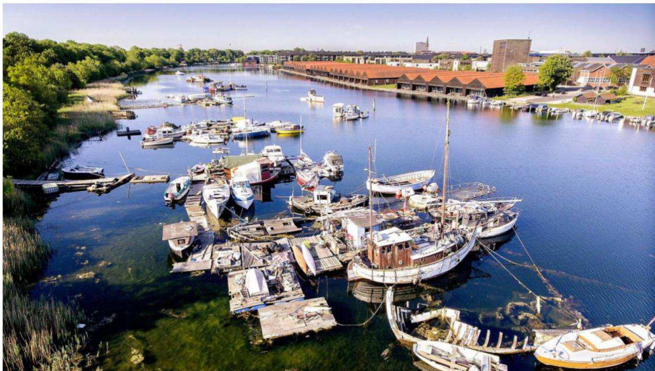
Fredens Havn ved Christiania mellem Refshalevej og Kanonbådsvej (Kanonhusene). Arkivfoto.