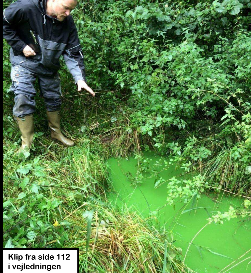
Klip fra side 112 i vejledningen

I tilfælde af, at en ejendom udleder til et drænsystem, hvor spildevandet transporteres til det forurenede vandområde, kan påbuddet, for så vidt angår fastlæggelse af drænsystemet, baseres på kommunalbestyrelsens oplysninger dvs. ved hjælp af BBR, eksisterende kortmateriale og hydrologiske oplande med vandskel.