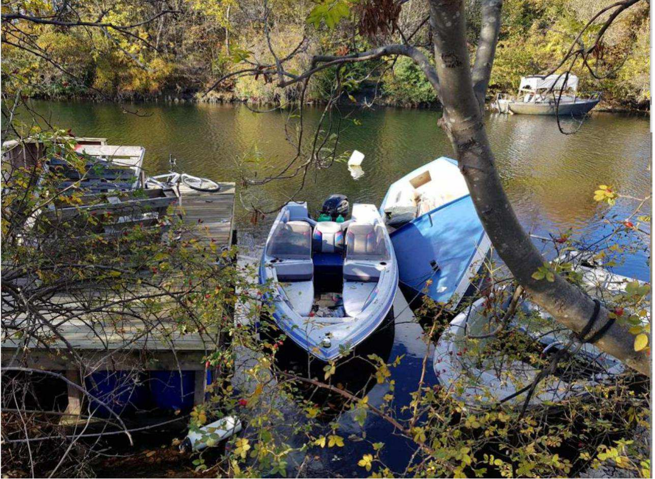
Laboratoriegraven oktober 2018